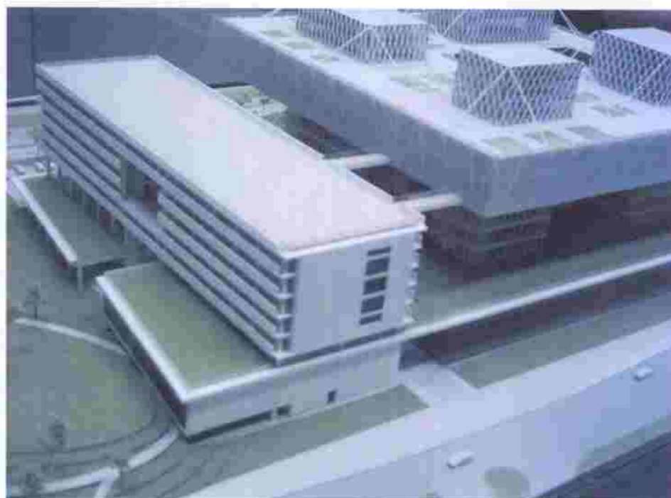
Artist's Impression of VTC campus at Tiu Keng Leng 職業訓練局調景嶺新校園的構思圖