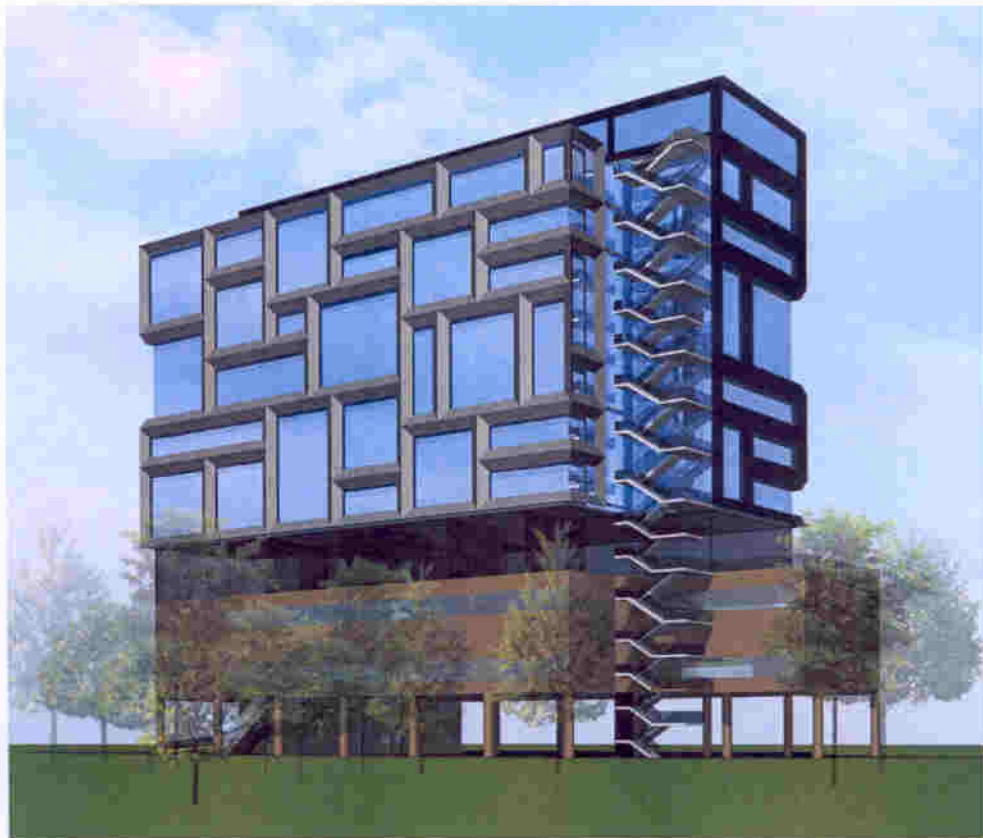
傳理學院暨創意／視覺藝術學院大樓(構思圖) School of Communication-cum-School of Creative/Visual Arts Building (Artist's Impression)

THE HONG KONG BAPTIST UNIVERSITY 19EH-SCHOOL OF COMMUNICATION-CUM- SCHOOL OF CREATIVE / VISUAL ARTS BUILDING 香港浸會大學 19EH – 傳理學院暨創意／視覺藝術學院大樓