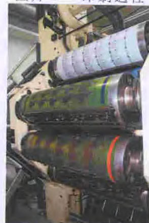
圖片 5 - 印刷過程