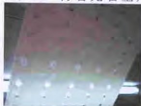
圖片 3 - 背著光看基片