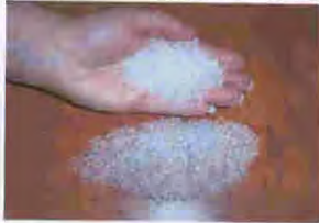
圖片 1 - 聚合物微粒