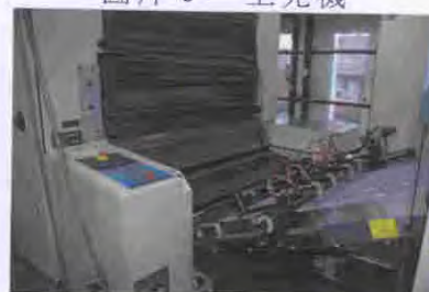
圖片 6 - 上光機