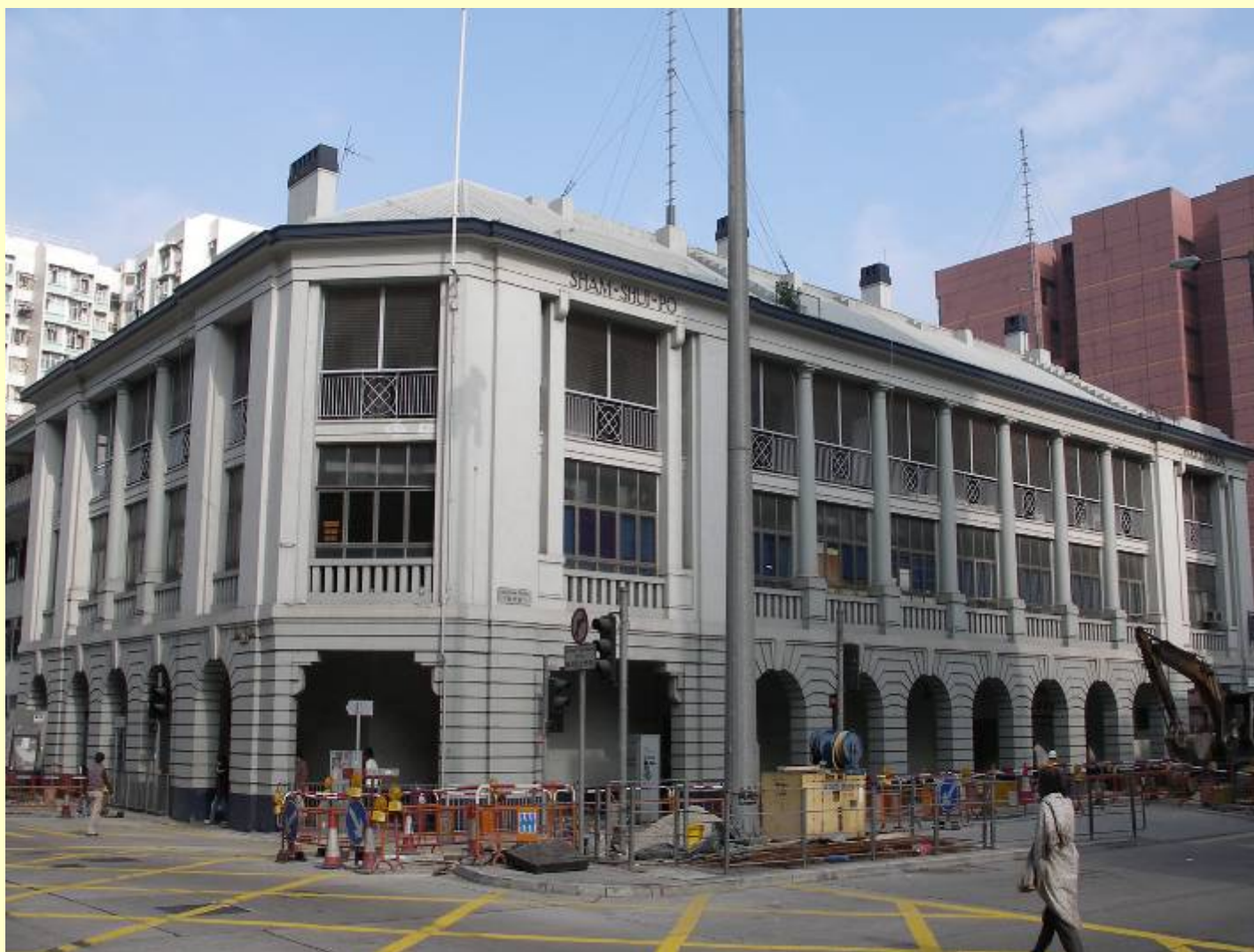
三級文物建築：深水埗警署