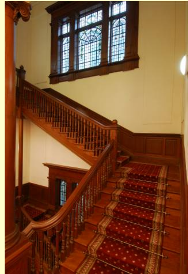
甘棠第：已改建為孫中山紀念館