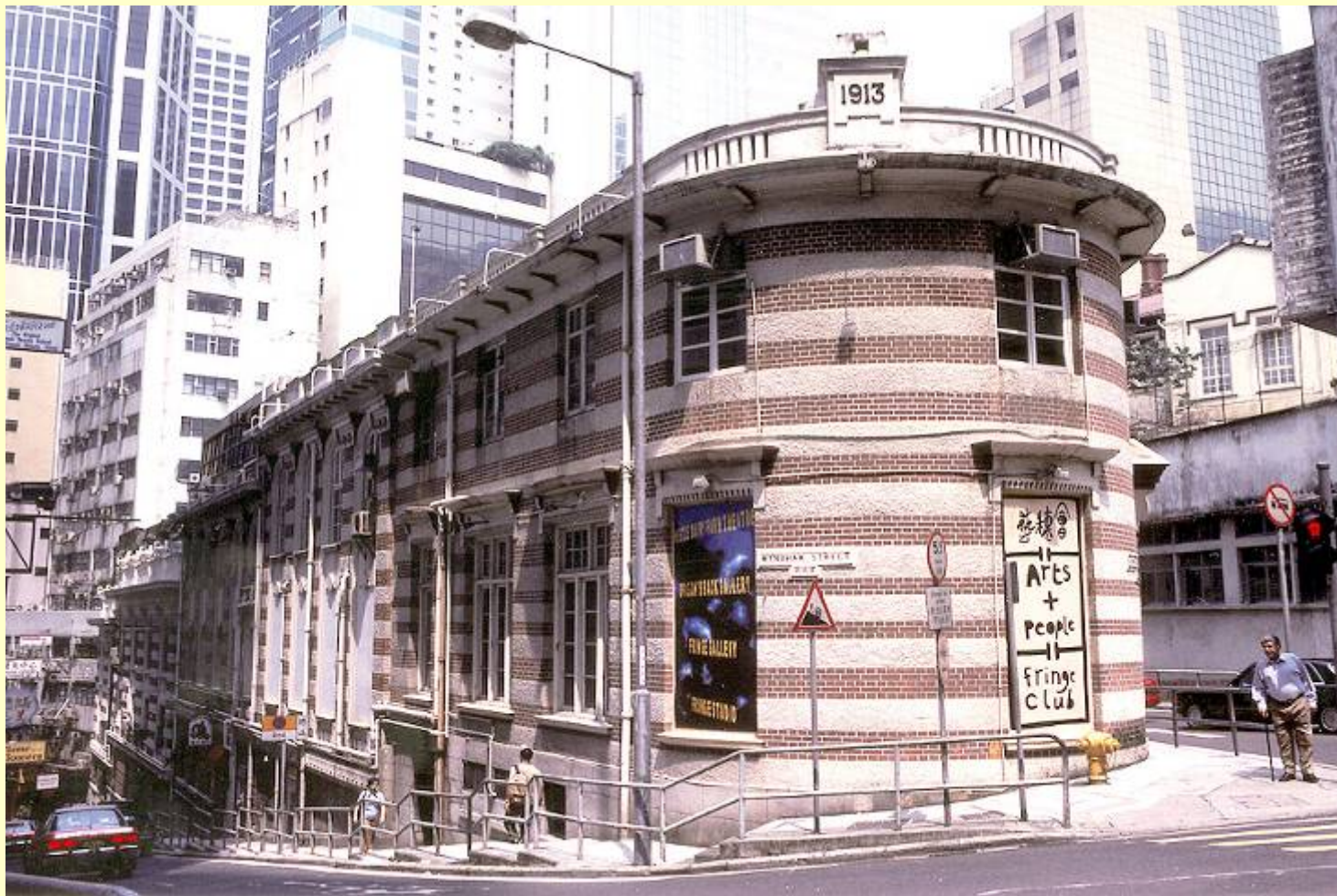
二級文物建築：舊牛奶公司寫字樓(藝穗會)