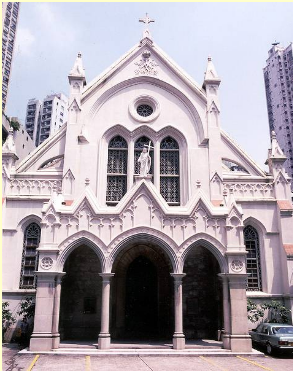
一級文物建築： 聖母無原罪主教座堂