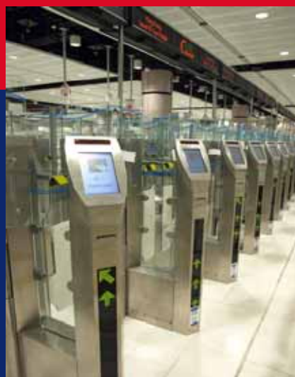
自助出入境檢查系統「e-道」