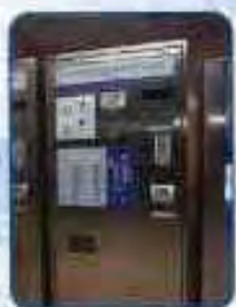
按掣式售票機 (東鐵車站)