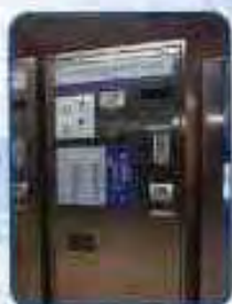
按掣式售票機 (東鐵車站)