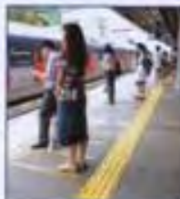
Tactile routes: Installed on the floor at station concourses and on platforms to lead visually impaired passengers to station entrances, lifts, ticket machines and for boarding trains.