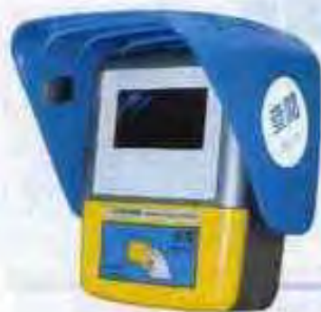
輕鐵月台上的八達通查閱機