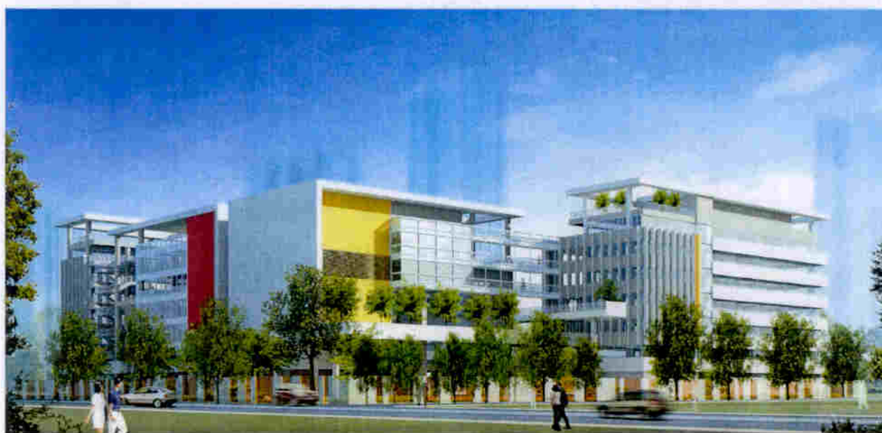
從南面望向校舍的構思圖