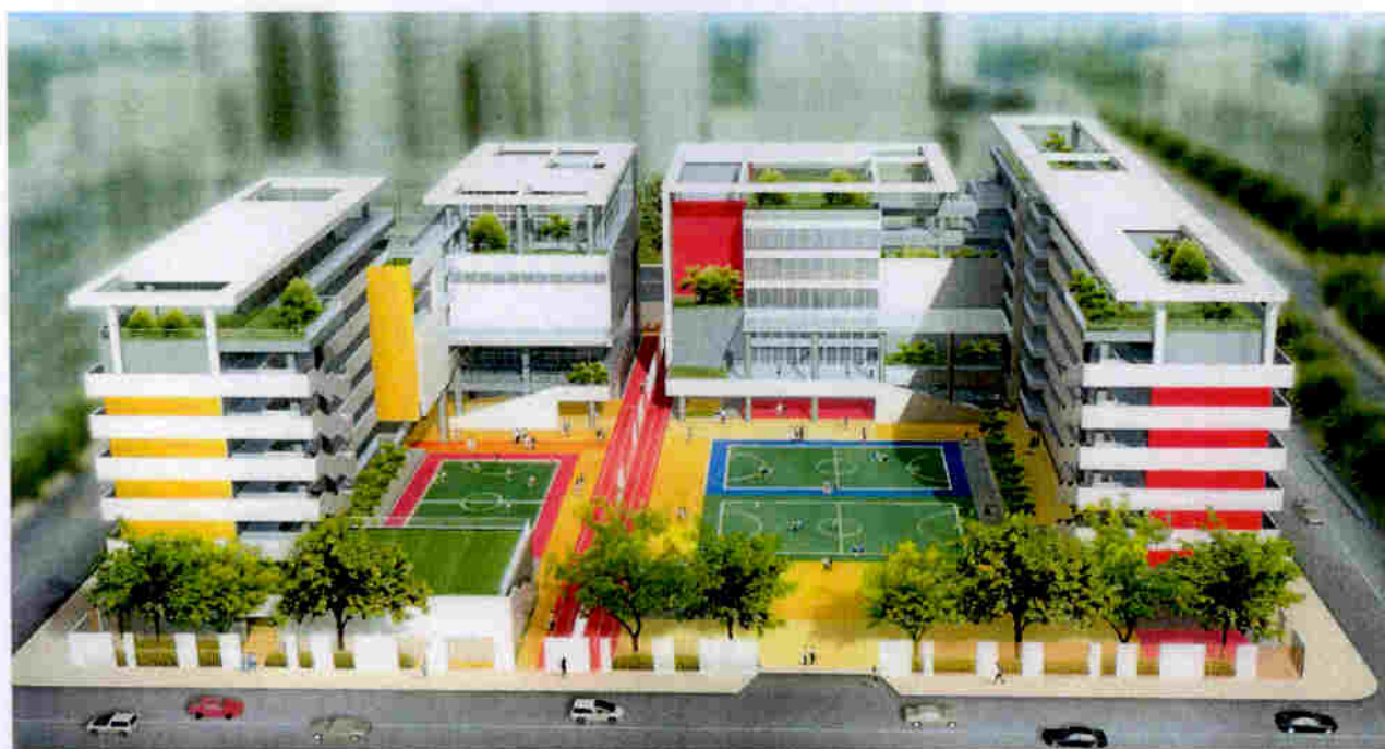
從東北面望向校舍的構思圖