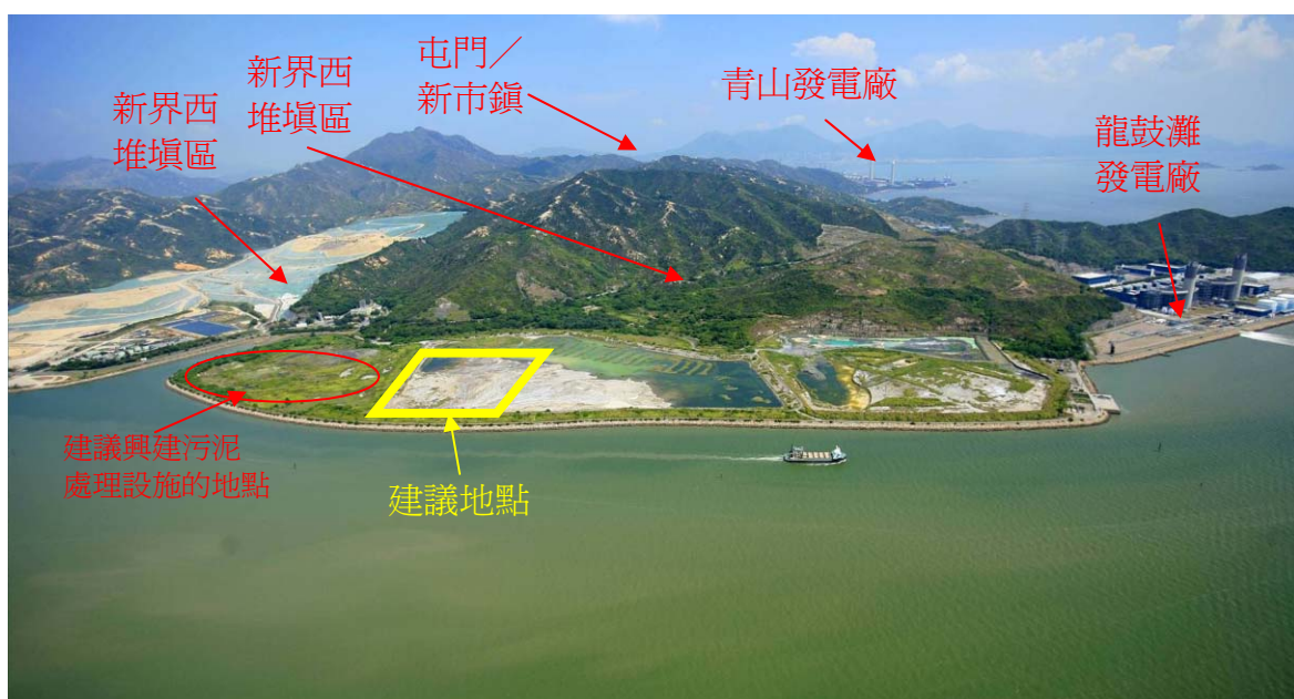
圖 7 – 曾咀煤灰湖的鳥瞰圖