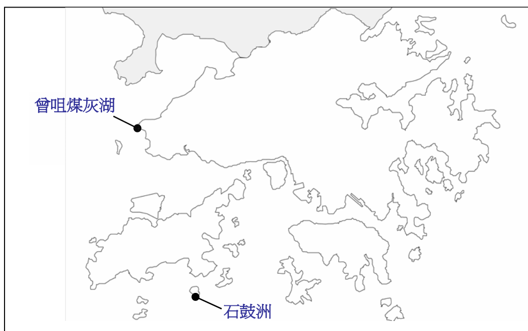
圖 1 - 可供考慮發展綜合廢物管理設施的地點

8. 根據選址研究結果（報告全文載於 附件 ），石鼓洲和曾咀煤灰湖符合上文所載的選址準則，可考慮用作發展綜合廢物管理設施第一期的地點。曾咀煤灰湖位於新界西北，毗連新界西堆填區和龍鼓灘發電廠。而石鼓洲選址則需透過在石鼓洲西南面進行填海，以取得所需土地。下文圖1顯示這兩個可供考慮發展地點的位置。