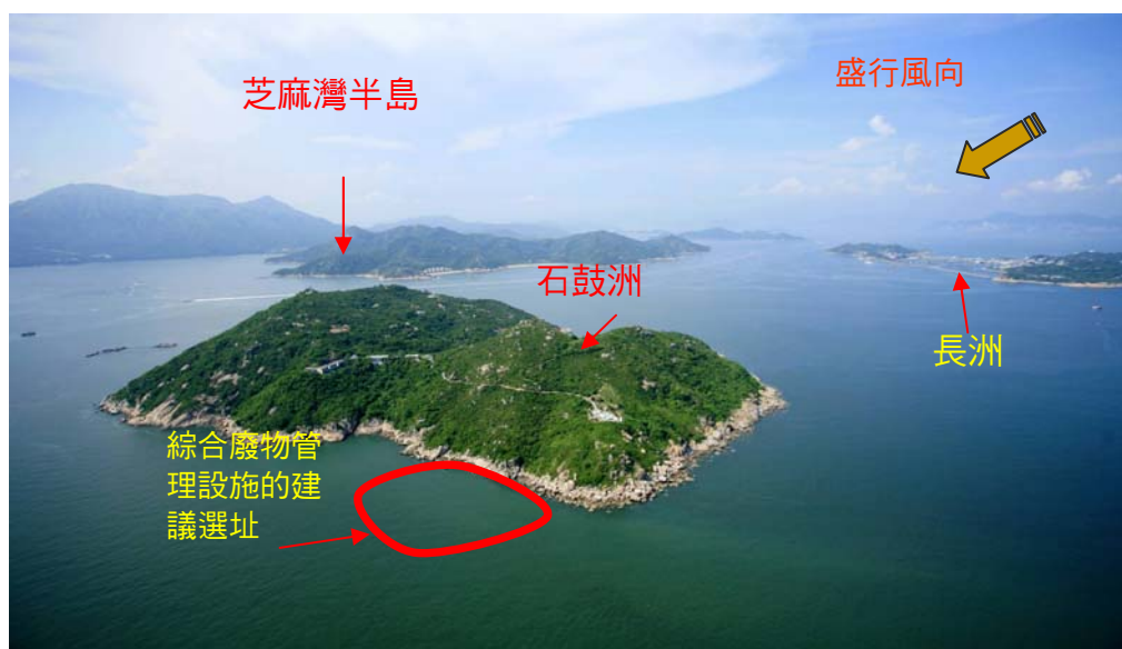
圖 6 – 石鼓洲的鳥瞰圖