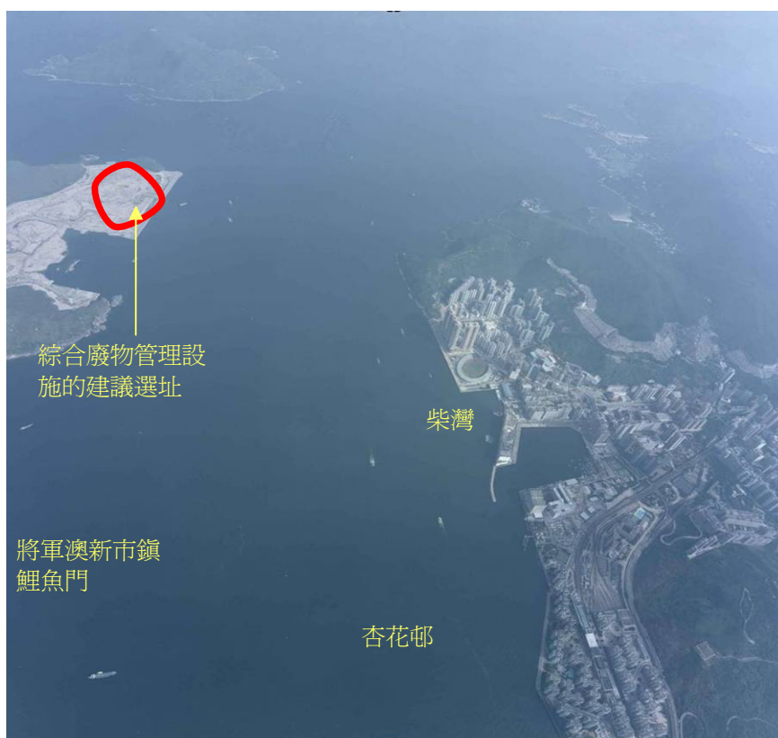
圖 2 – 將軍澳第 137 區的鳥瞰圖