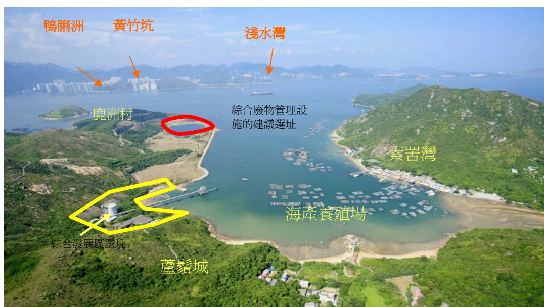
圖 3 – 南丫島石礦場舊址的鳥瞰圖