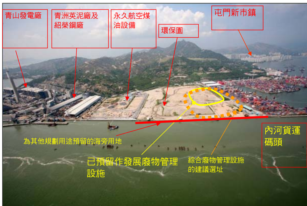
圖 5 – 屯門第 38 區的鳥瞰圖