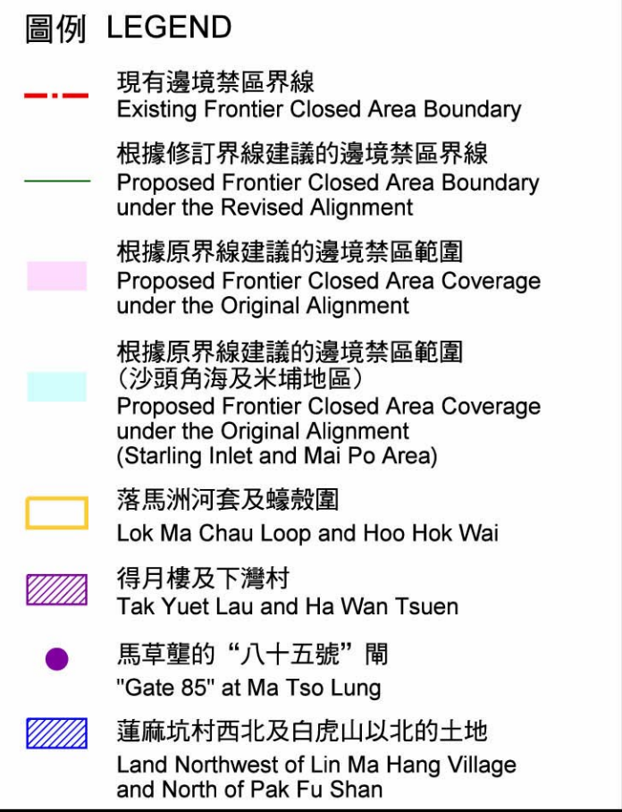
現有的邊境禁區界線及建議的邊境禁區範圍