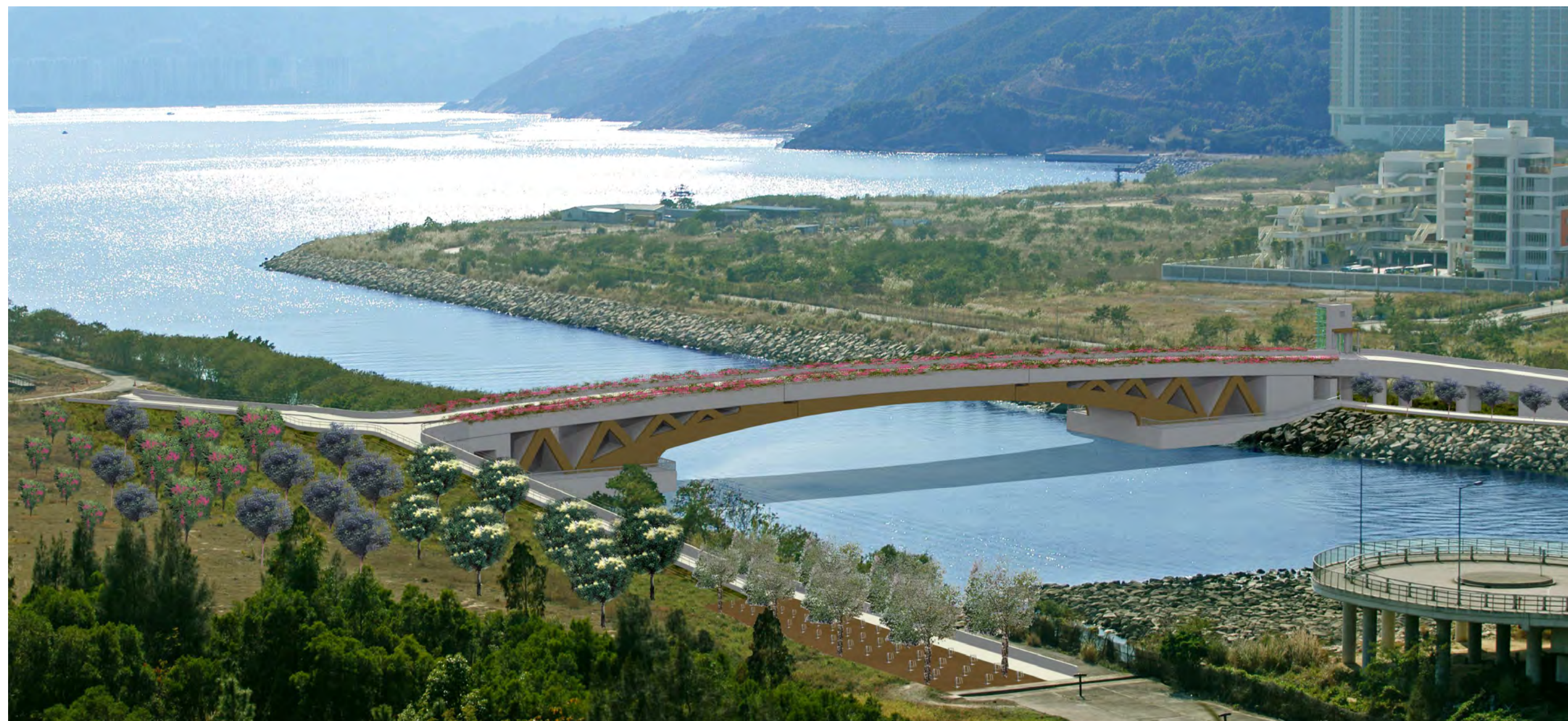
Perspective View of Completed Bridge and Surrounding Landscape Works 天橋及附近的園林設計完成後的透視圖