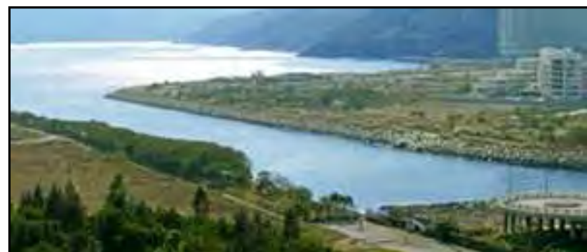
Existing Environment 現有環境