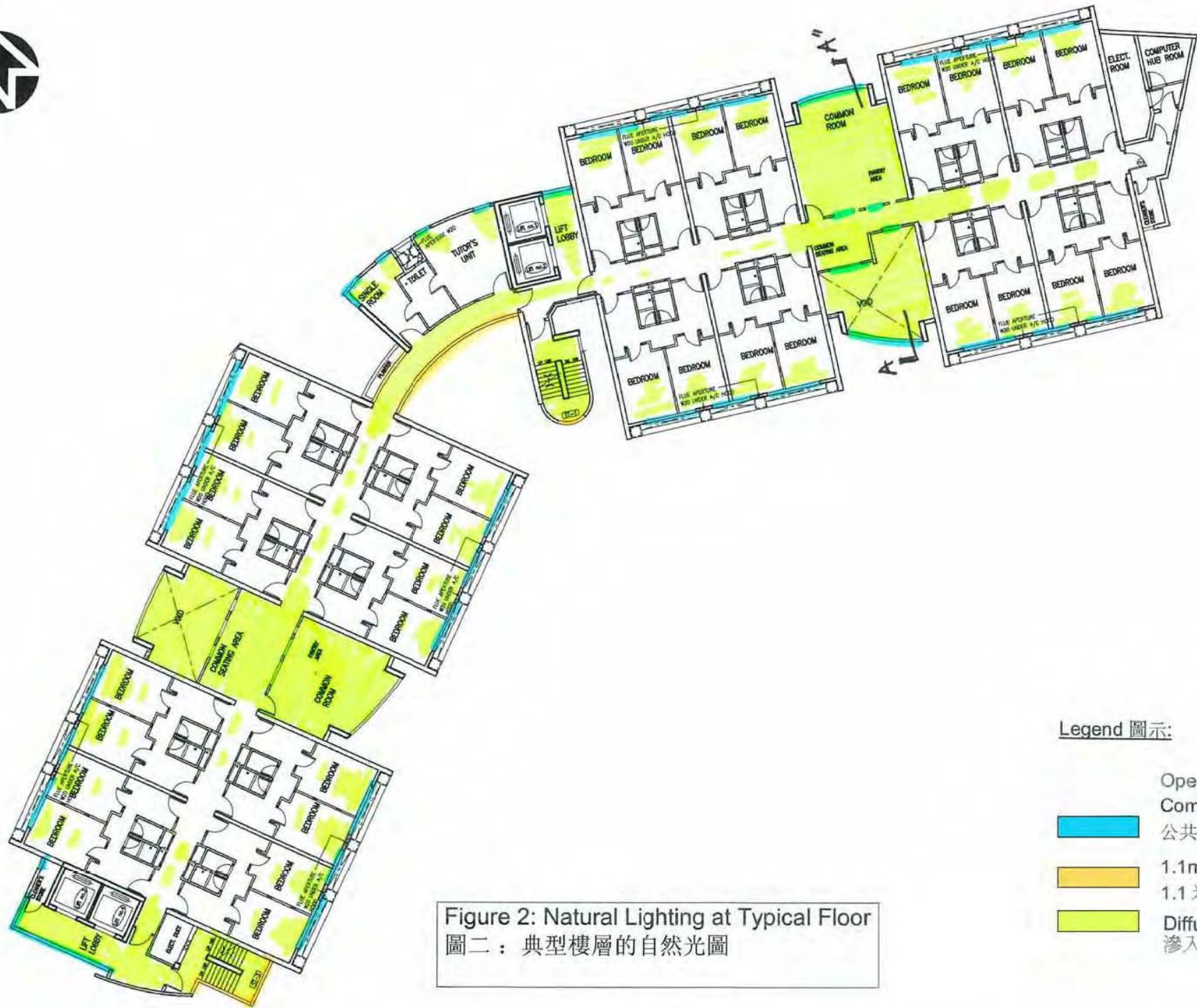
Figure 2: Natural Lighting at Typical Floor 圖二：典型樓層的自然光圖