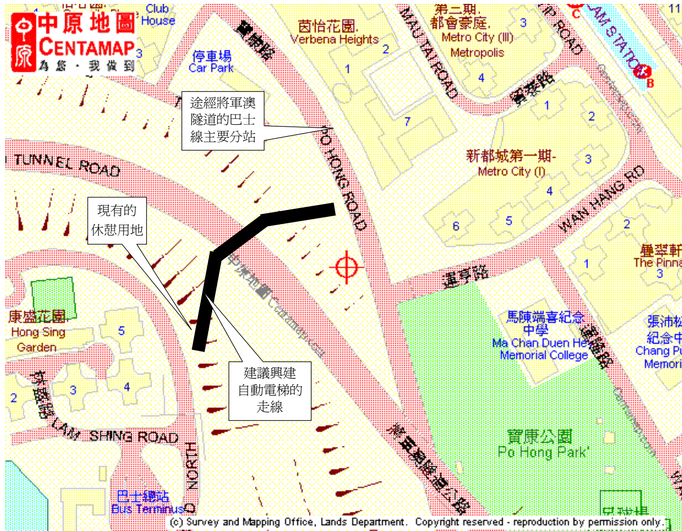
附件：康盛花園與寶康路之間興建自動電梯系統建議圖