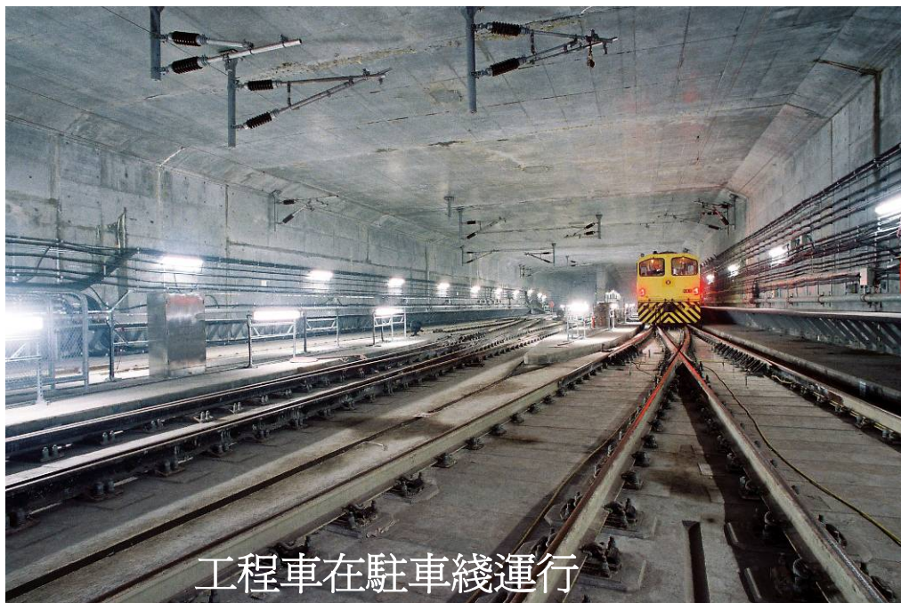
工程車在駐車綫運行