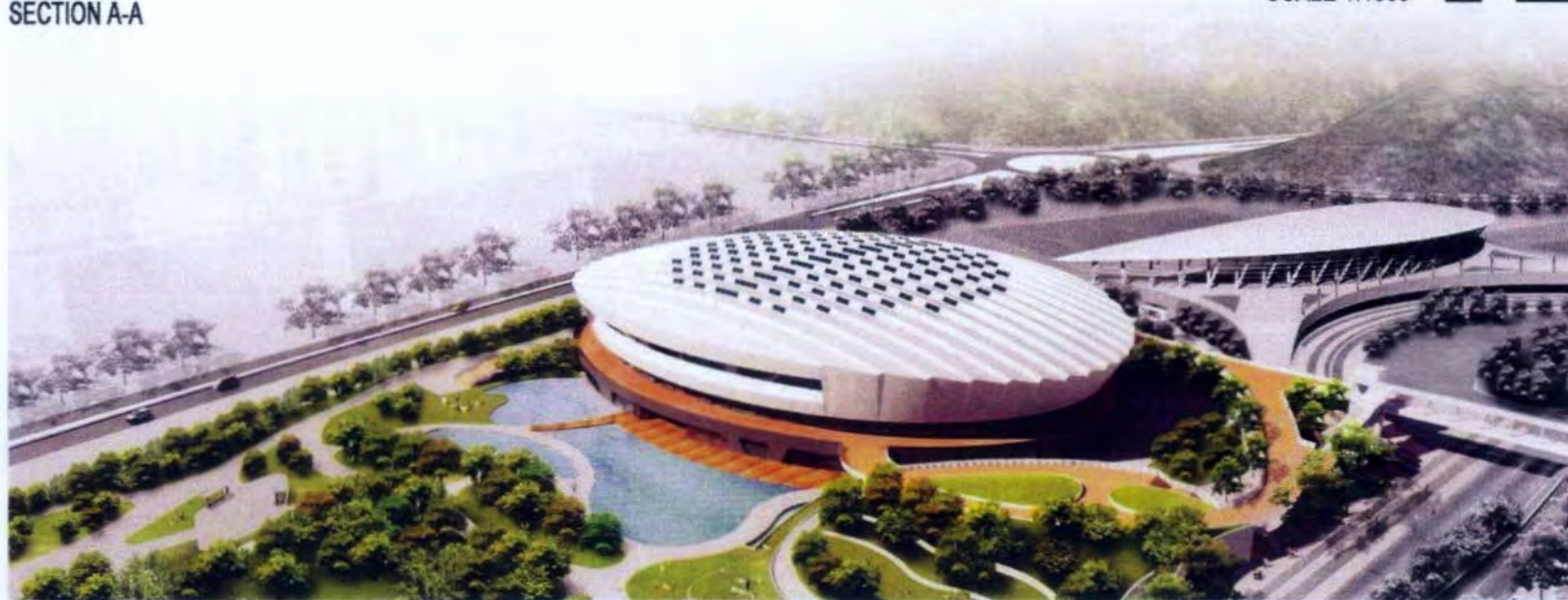
西面鳥瞰圖 AERIAL VIEW FROM WESTERN DIRECTION (ARTIST'S IMPRESSION)