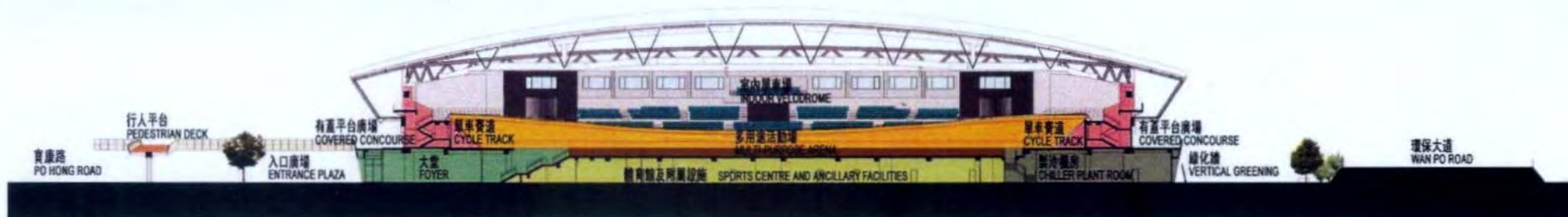
剖面圖 A-A SECTION A-A