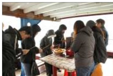
進行簡單悼念儀式