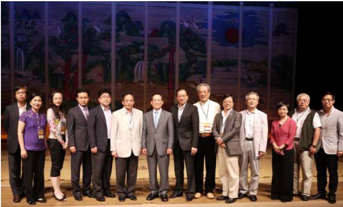
訪問團與韓國傳統表演藝術中心代表合照。