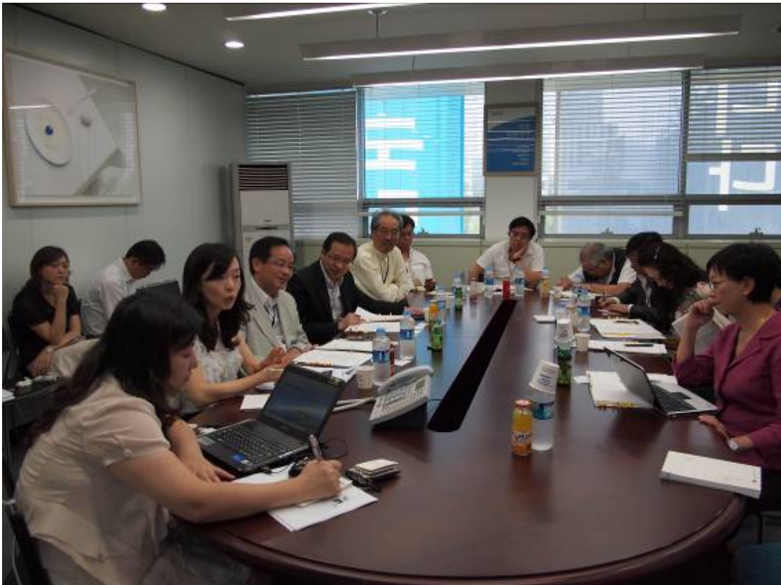
訪問團與文化體育觀光部會晤。