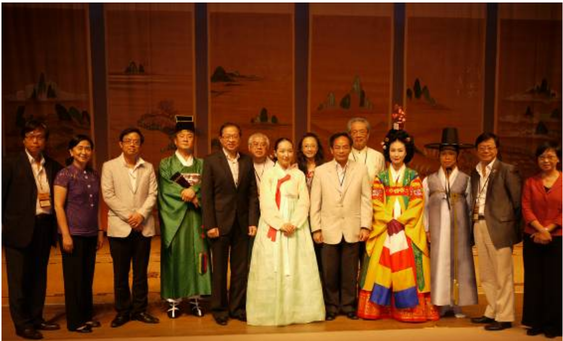
訪問團與表演傳統音樂及舞蹈的藝術家在韓國表演藝術中心合照。