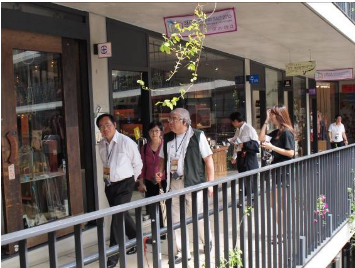
訪問團參觀仁寺洞文化區。