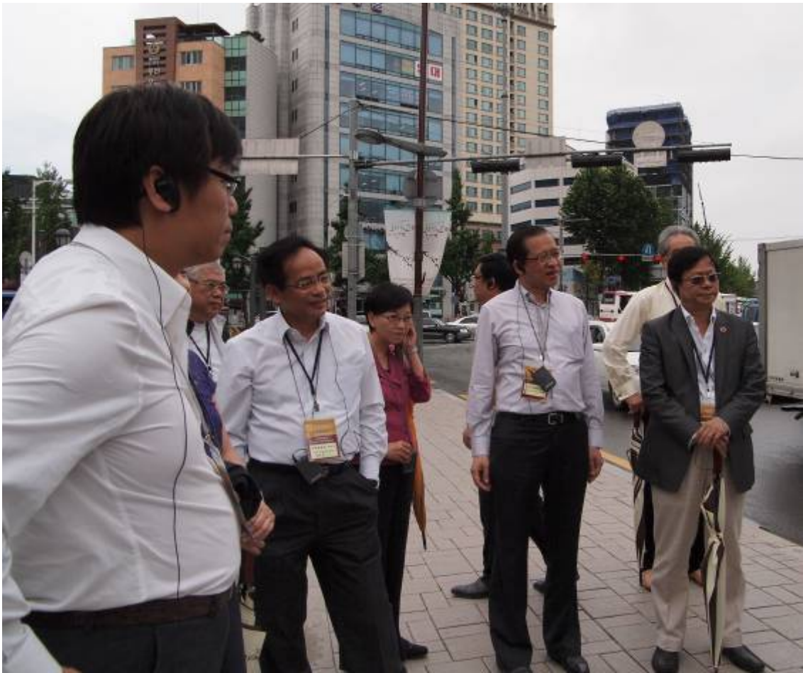
訪問團在參觀仁寺洞文化區前，聽取職員簡介。