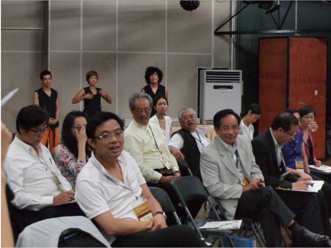
訪問團於Noridan 與 Haja基金會觀賞一項藝術表演。