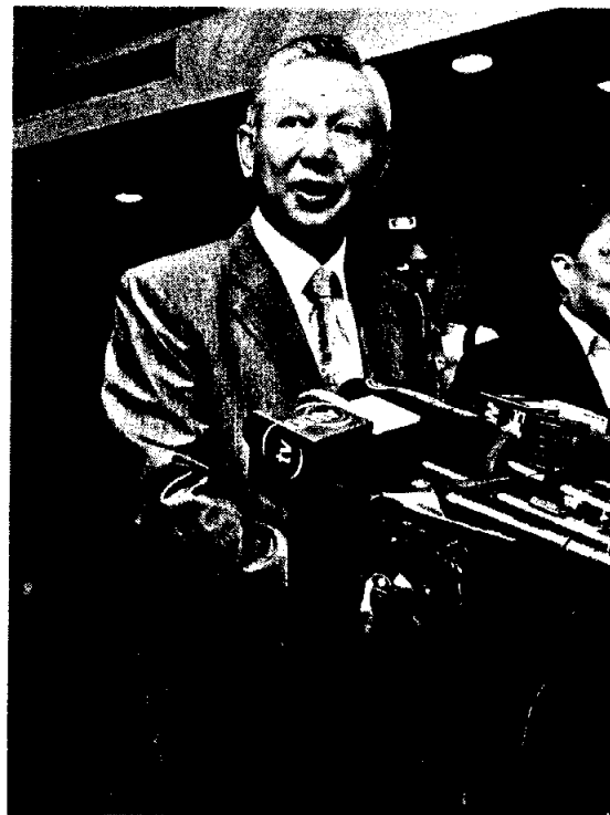
特區政府昨早收到港旅行團遭挾持事件後，保安局長李少光（圖）隨即啟動應變機制，並安排該局副局長黎棟國、社署、警方及心理專家等午夜乘坐包機往菲律賓。

挾持事件一直膠着，特首辦及相關官員一直透過電視直播了解事態發展。入夜後形勢急轉直下，當得悉有人質中槍及一度誤傳人質全部被殺後，特首即時傳召三名司長及相關局長在政府總部召開緊急會議商討對策，政府總部外排滿AM（政府車）車輛及大量警察，氣氛緊張。