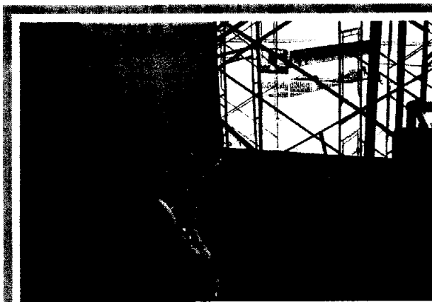
槍匪挾持港旅行團人質持續多時，但菲律賓警方昨午在現場部署的狙擊手，卻兩番錯失救人時機。