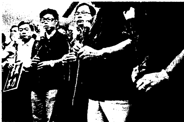
多個團體到菲駐港領事館抗議和默哀。

另外，本港多個團體先後到菲律賓駐港總領事館抗議，不滿當地警方營救不力。其中廿多名民建聯成員下午到場並默哀，要求菲律賓當局徹查事件並公開報告。自由黨成員則穿著黑色衣服，促請詳細交代事件，否則呼籲市民考慮不到當地旅行。另外十多名網民亦到場抗議，菲律賓駐港總領事柯明親自接收抗議信，並對事件非常遺憾，會盡力協助家屬。