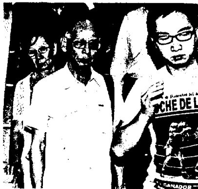
◀死裡逃生李姓夫婦（中及左）昨搭機返港

【本報訊】保安局局長李少光表示，政務司司長昨日再次傳召菲律賓駐香港總領事，強烈表達特區政府的三個要求。政府包機預計最快在今晚之前，將遺體運返香港；兩名在事件中沒有受傷的李氏夫婦，已安排他們乘坐定期航班於昨晚返港。