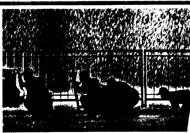
菲警昨晚荷槍實彈，強攻旅遊巴，雙方發生激烈槍戰。