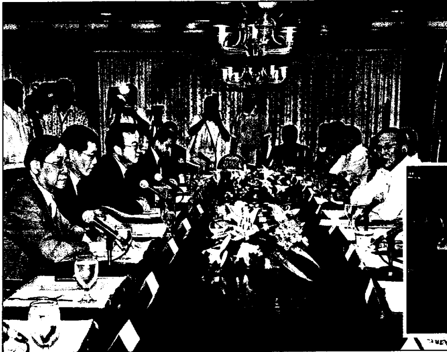
Lai Tung-kwok, extreme left, and Liu Jianchao, third from left, lead Hong Kong and mainland officials in a meeting with Benigno Aquino, right, in Manila. Meanwhile, Donald Tsang, second from right, leads the mourning for the victims at Leighton Hill Community Hall, inset.