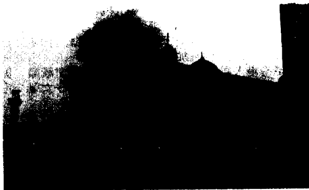
2008年11月，印度孟買十多處被武裝分子襲擊，亂槍掃射，挾持數十名西方人質及5名中國公民。（資料圖片）