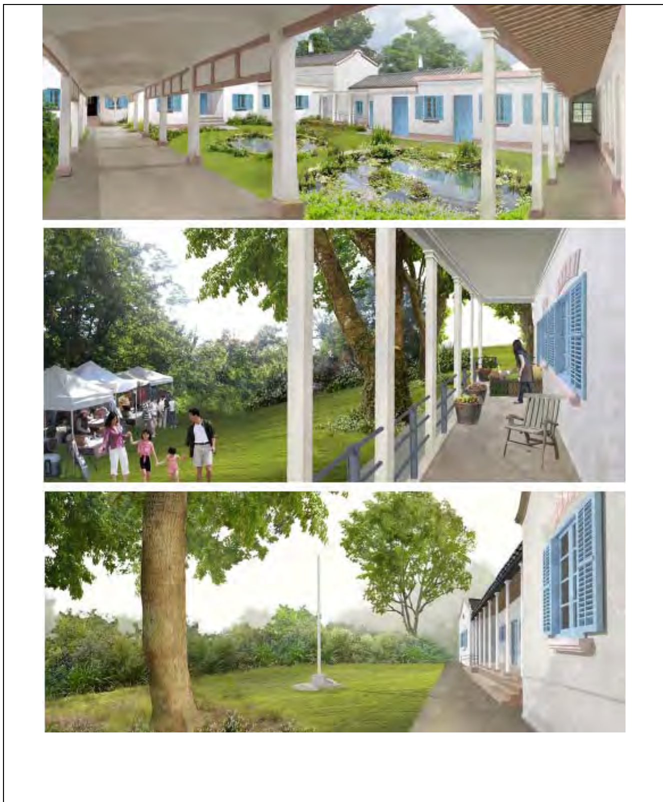
活化舊大埔警署為「綠滙學苑」 「綠滙學苑」的模擬圖片