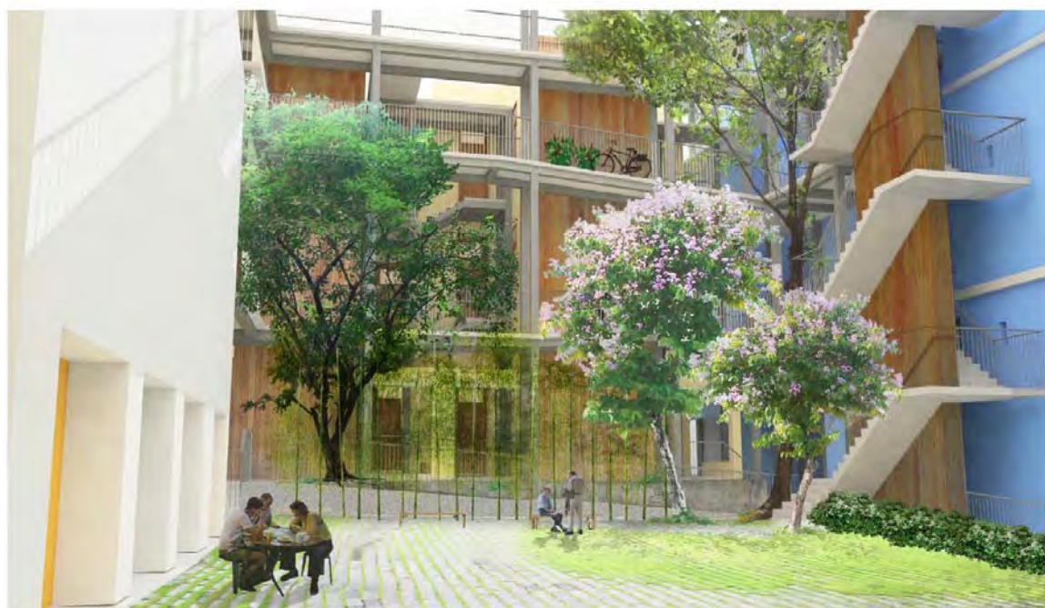
活化藍屋建築羣為「We 嘩藍屋」 「We 嘩藍屋」的模擬圖片