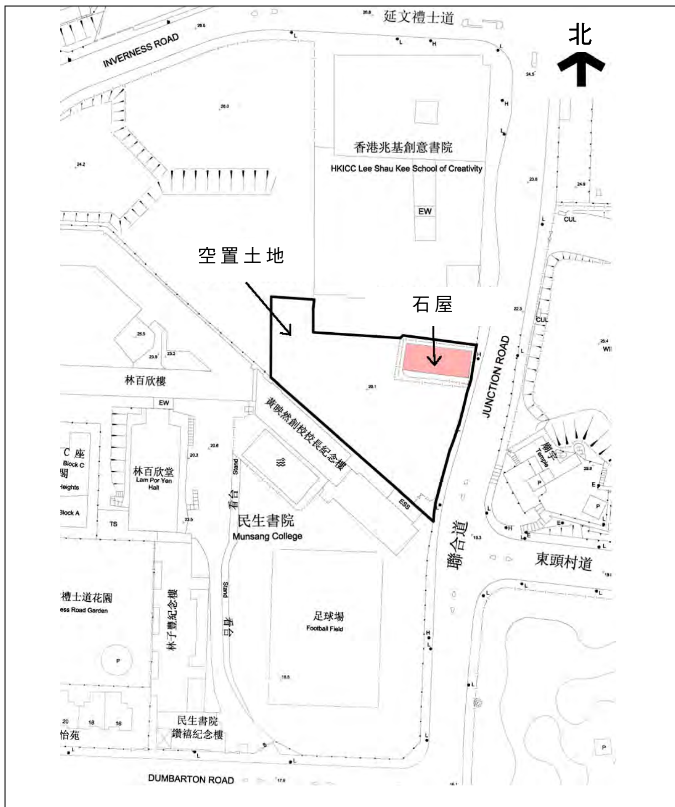
活化石屋為「石屋家園」 平面圖