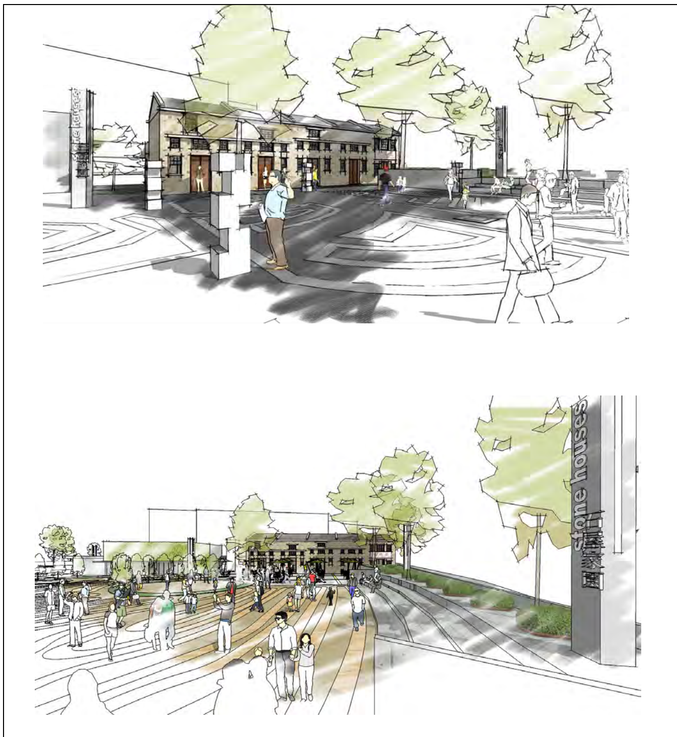
活化石屋為「石屋家園」 「石屋家園」的模擬圖片