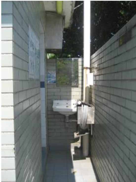
Before conversion 改建前