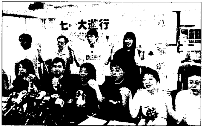
Organizers of the July 1 march are geared up for the 'big rally.' SING TAO