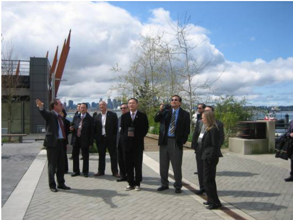
北溫哥華市海濱項目辦事處的代表向訪問團成員簡介溫哥華下蘭斯黨一個重建地點。