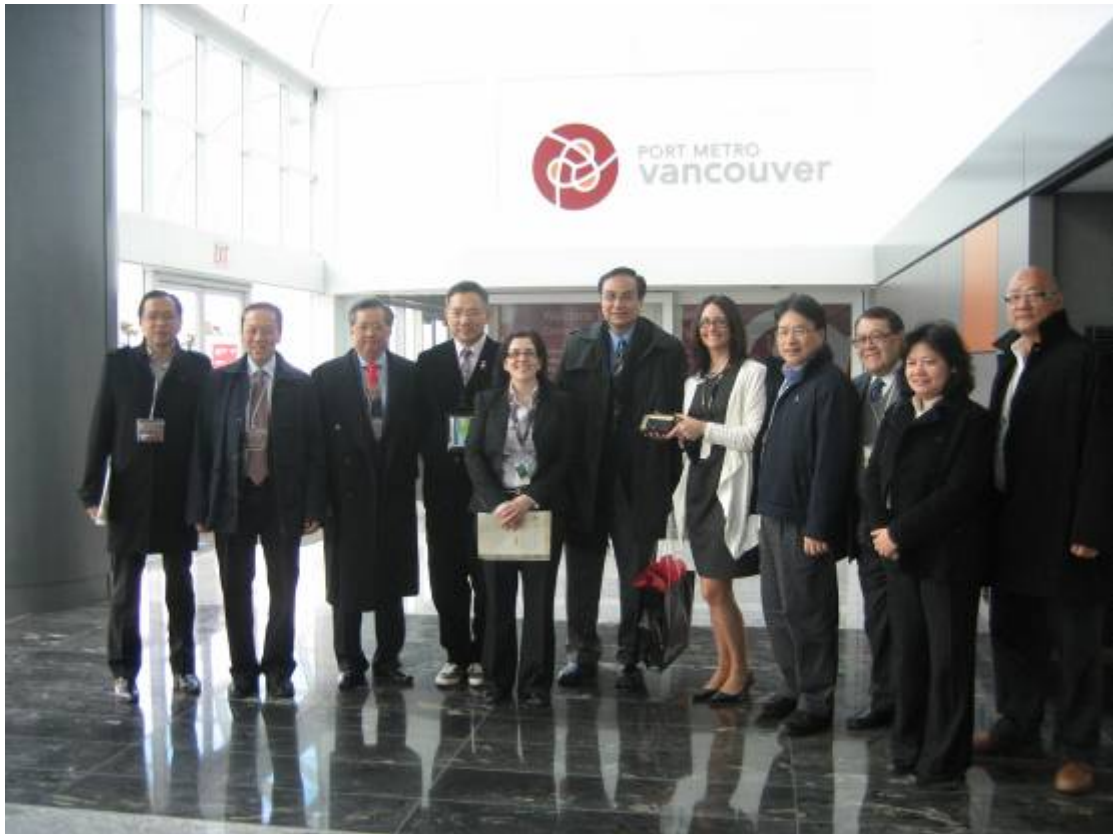
立法會海濱規劃事宜小組委員會訪問團與溫哥華港務局的代表討論溫哥華港口及碼頭的規劃和發展事宜後合照。