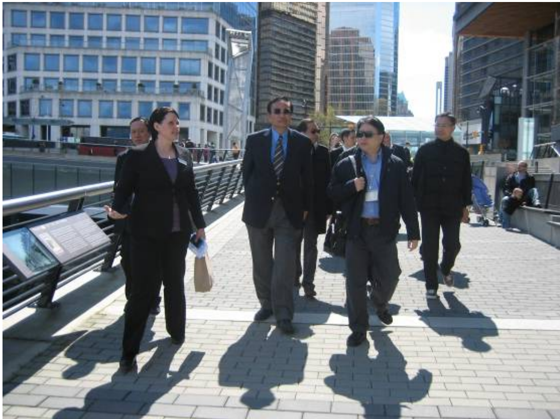
訪問團成員參觀溫哥華會議中心的海濱長廊。