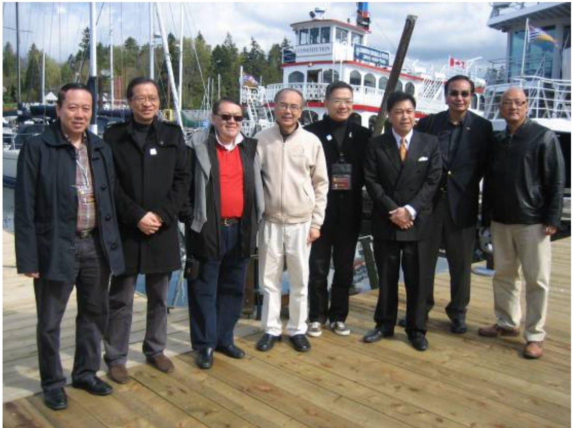
訪問團在溫哥華與溫哥華市議會議員乘船參觀，聽取他們對海濱發展和管理事宜的意見。