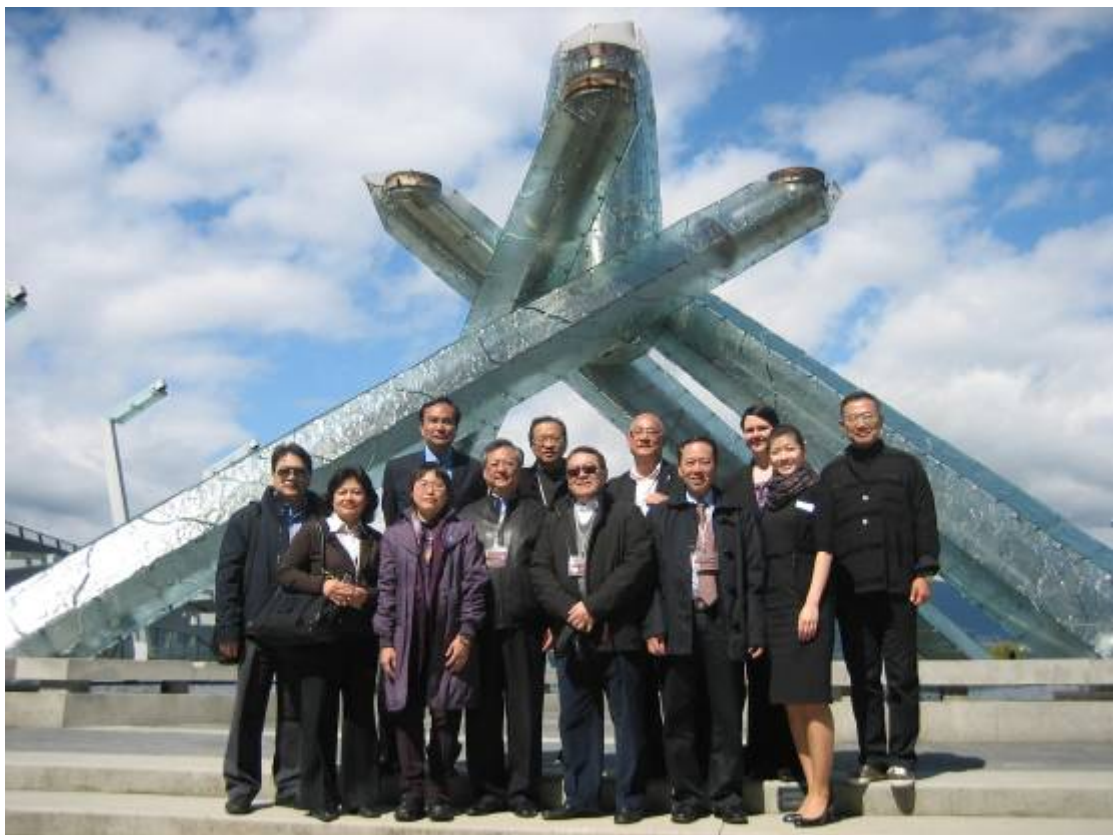
訪問團成員參觀溫哥華會議中心範圍內的海濱公眾休憩用地，並與溫哥華會議中心的代表合照。