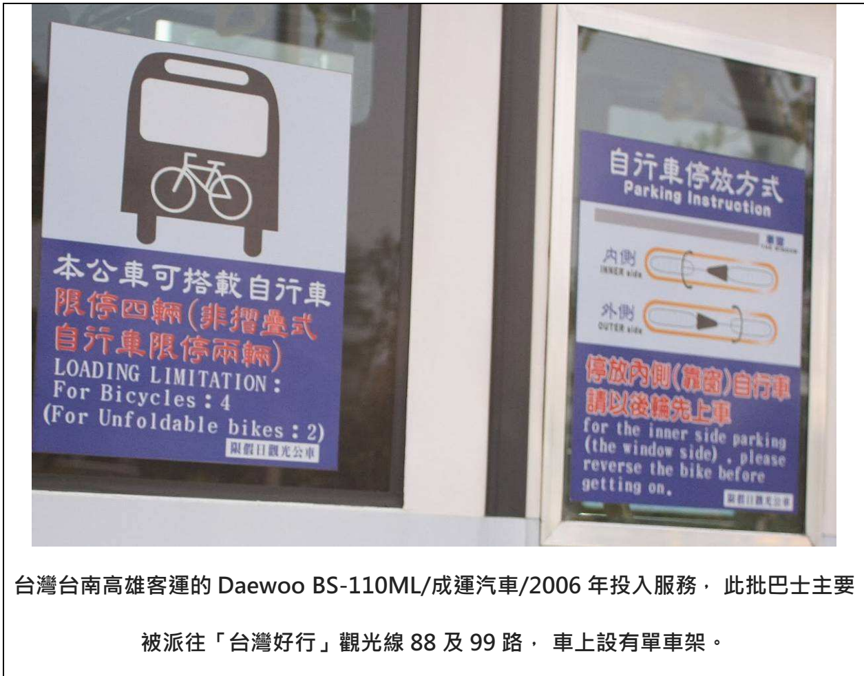
台灣台南高雄客運的 Daewoo BS-110ML/成運汽車/2006 年投入服務，此批巴士主要被派往「台灣好行」觀光線 88 及 99 路，車上設有單車架。