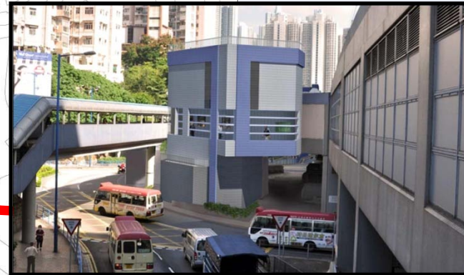
重置的觀塘美沙酮診所的景觀 View of the reprovisioned Kwun Tong Methadone Clinic