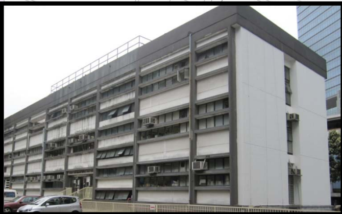
觀塘賽馬會健康院 Kwun Tong Jockey Club Health Centre