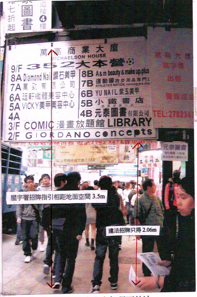
屋宇署招牌指引相距地面空間 3.5m