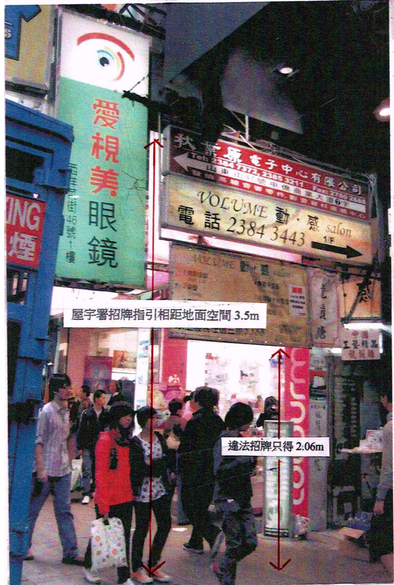
屋宇署招牌指引相距地面空間 3.5m

屋宇署廣告招牌指引，規限招牌相距地面空間最少有 3.5m，政府無理姑息違例不執法