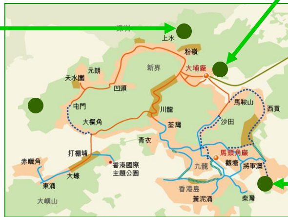
2015 (預計) —新界東南