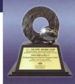
2011 香港工商業獎 HONG KONG AWARDS FOR INNOVATION 機器及機械工具設計獎 MACHINERY AND MACHINE TOOLS DESIGN AWARD

明火烹調為美食之本，高效能煤氣爐具，為名廚的好幫手。煤氣公司不斷研發新產品，煤氣涼廚四寶：炒鑊爐、蒸爐、蒸櫃、平底爐，更榮獲2011年香港工商業獎，證明業界選擇煤氣作為商業伙伴，實為明智之舉。高效能的涼廚四寶除可節省成本，締造清新涼廚，更可提升生產力，讓您在競爭中佔盡優勢。