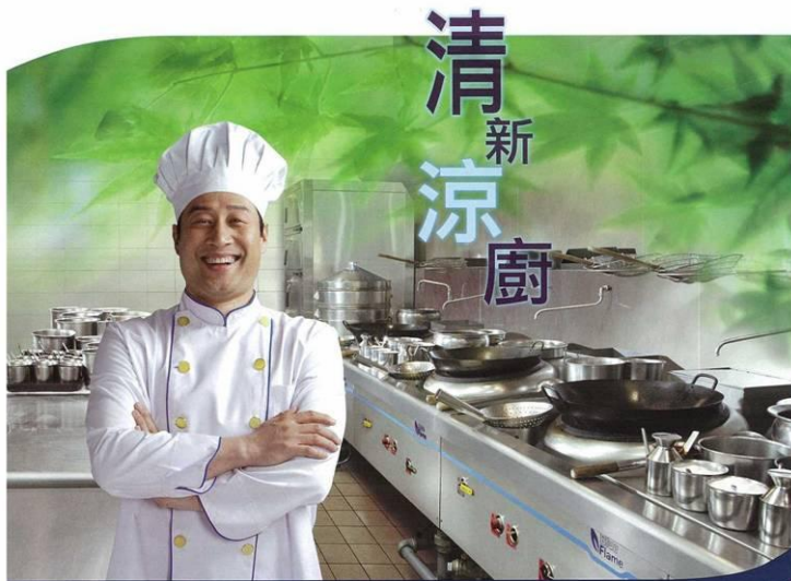
煤氣涼廚四寶 榮獲香港工商業獎