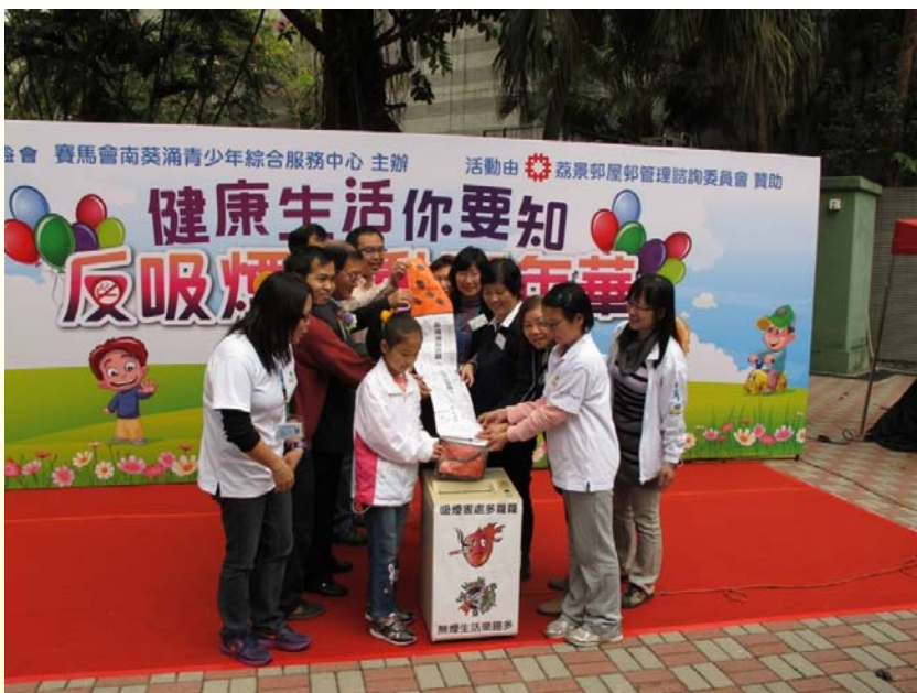
反吸煙活動嘉年華