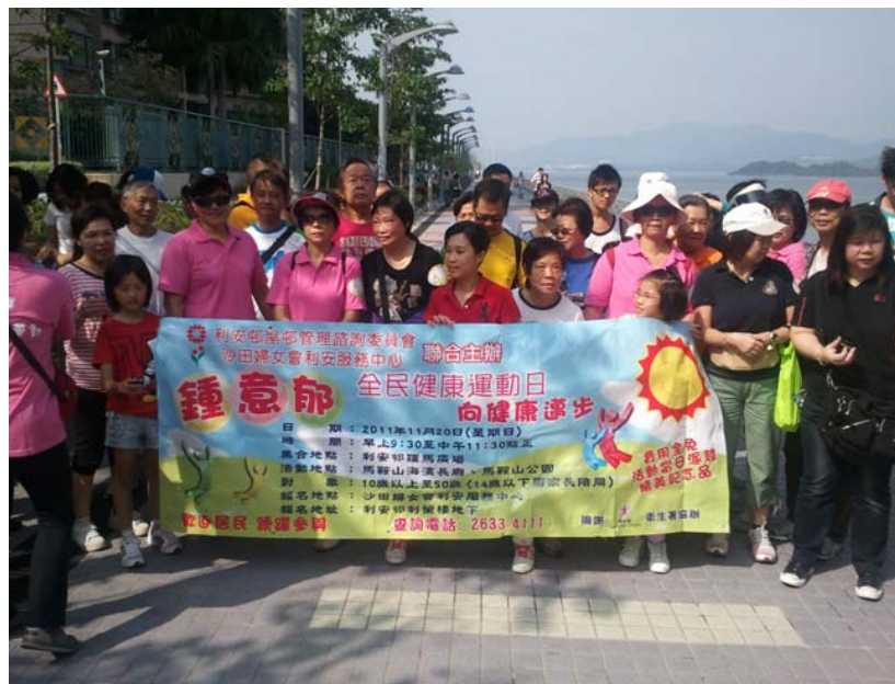
「鍾意郁」全民健康運動日