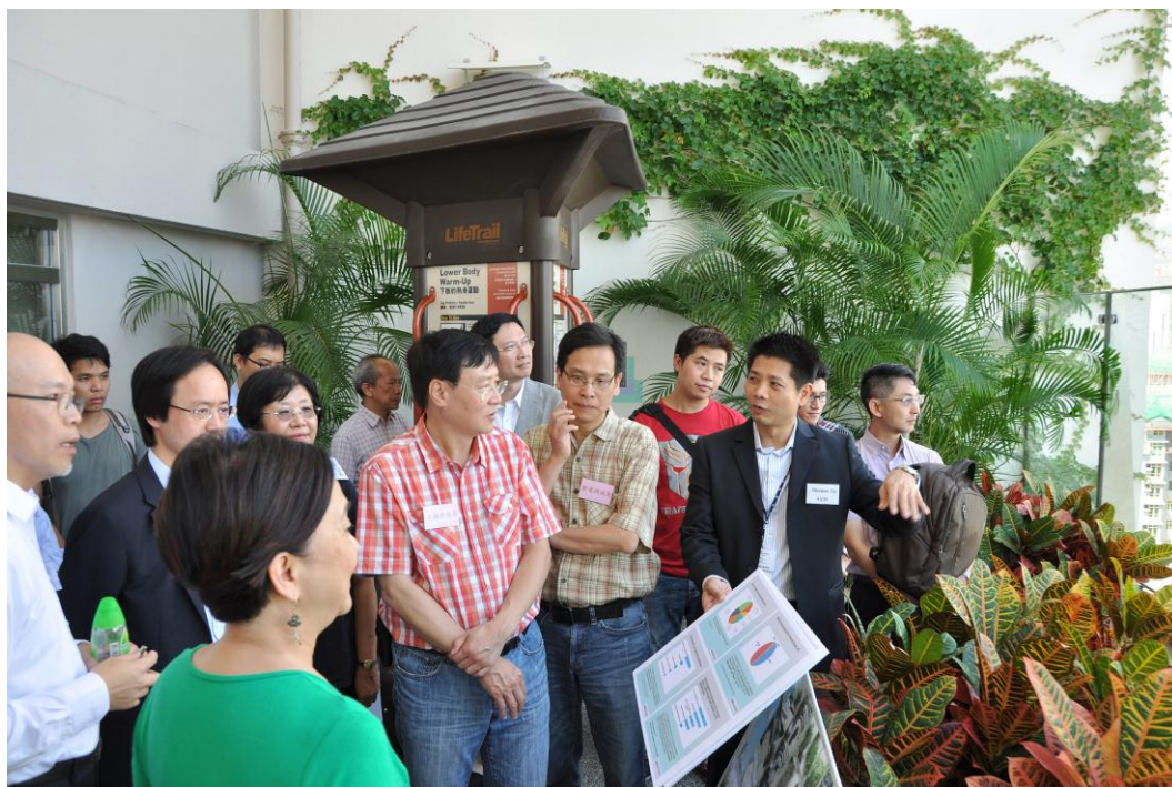
立法會議員參觀葵涌葵聯邨一個位於三十三樓的公用平台。