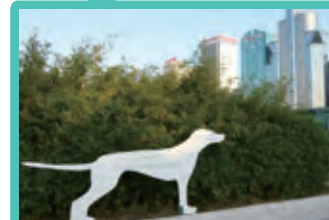
Wan Chai 灣仔