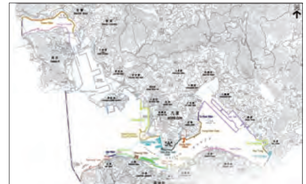
22 Action Areas 22個行動區