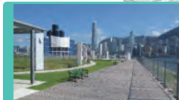
West Kowloon Cultural District 西九文化區