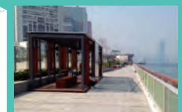
Quarry Bay 鯉魚涌