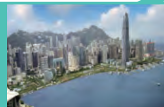
New Central Harbourfront 中環新海濱