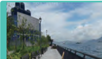
Sheung Wan 上環