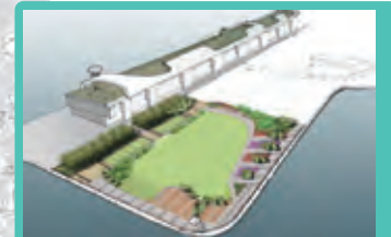
Kai Tak 啟德