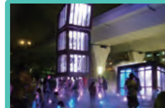
Kwun Tong 觀塘