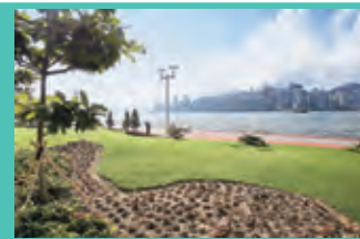
Hung Hom 紅磡

在前共建維港委員會和海濱事務委員會的建議下，當局展開了多個優化海濱的短期項目，讓市民能早日享用。近年落成的項目包括觀塘海濱花園第一期、紅磡海濱長廊、以及位於中環新海濱及鯉魚涌海濱的海濱長廊前期工程。