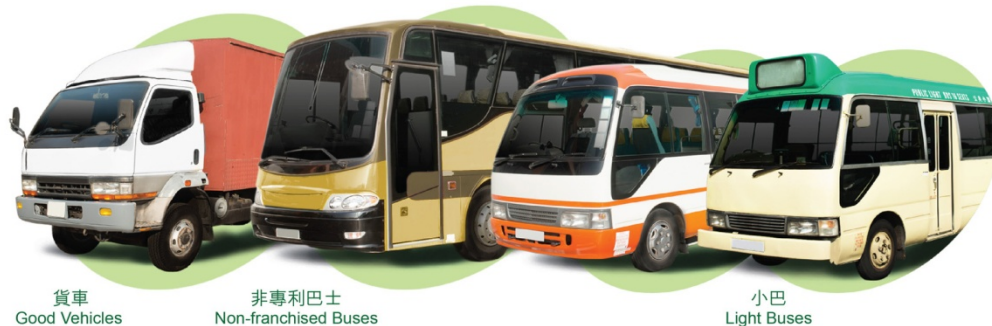
貨車 Goods Vehicles