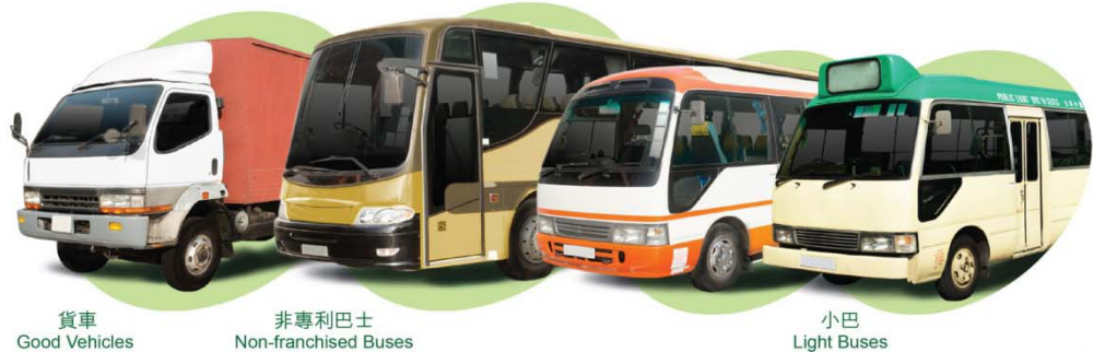
貨車 Good Vehicles