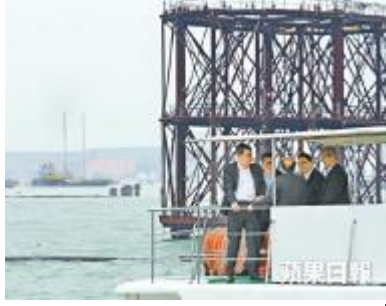
■ 梁振英本月 4 日視察港珠澳大橋工程，但對工程違法視