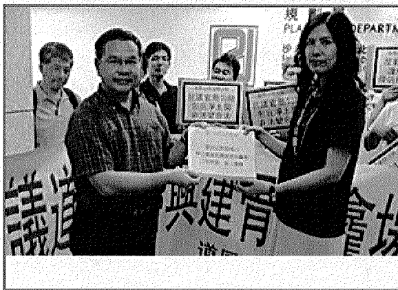
道風山環境關注組向規劃署遞信