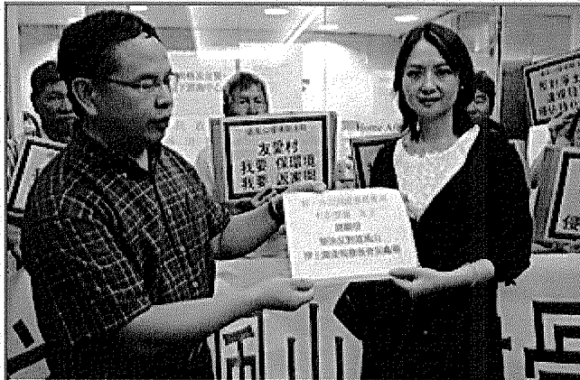
道風山環境關注組向沙田民政事務處遞交請願信