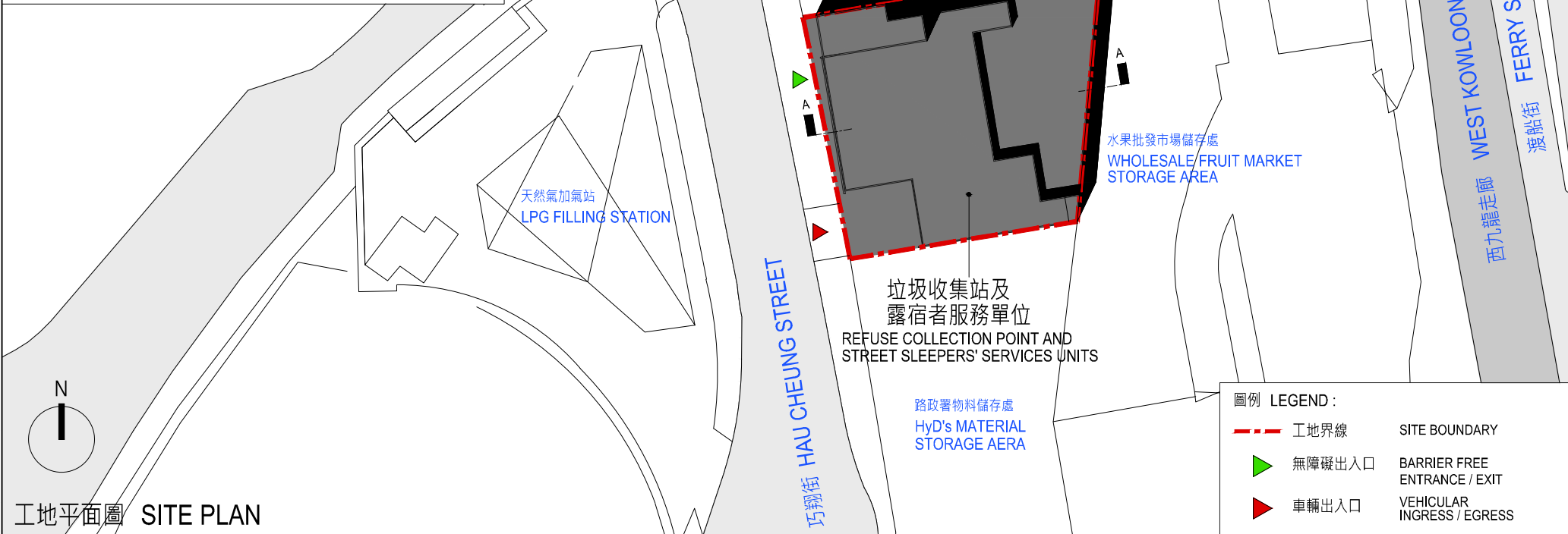
工地平面圖 SITE PLAN