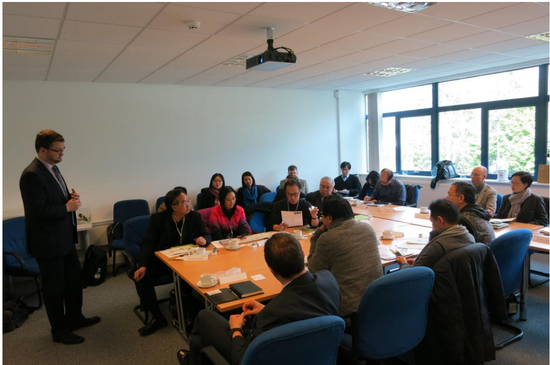
訪問團聽取 Swindon 氣化廠代表的簡介。