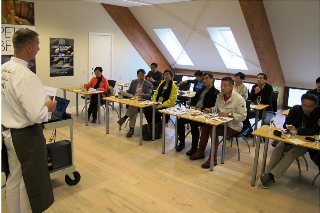
立法會代表團參觀一家位於哥本哈根的巧克力製造商，並聽取有關丹麥食品加工業最新發展的簡介。