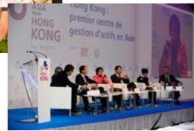
「邁向亞洲首選香港」 (2014年10月28日：巴黎)