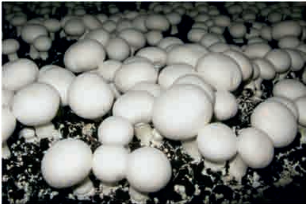
利用現代化方法控制溫度、濕度和光度栽培磨菇