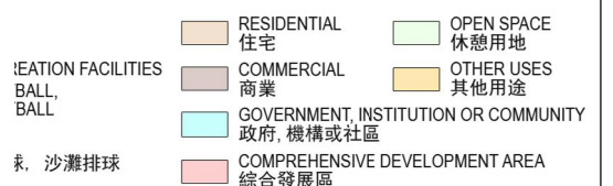
TAK 啟德體育園區總綱發展示意圖