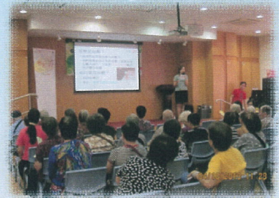
「我好叻」 社區健康推廣計劃