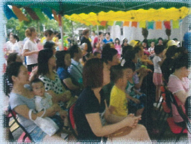
推廣鄰里和諧共融活動