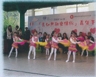
「長幼共融樂繽紛」嘉年華