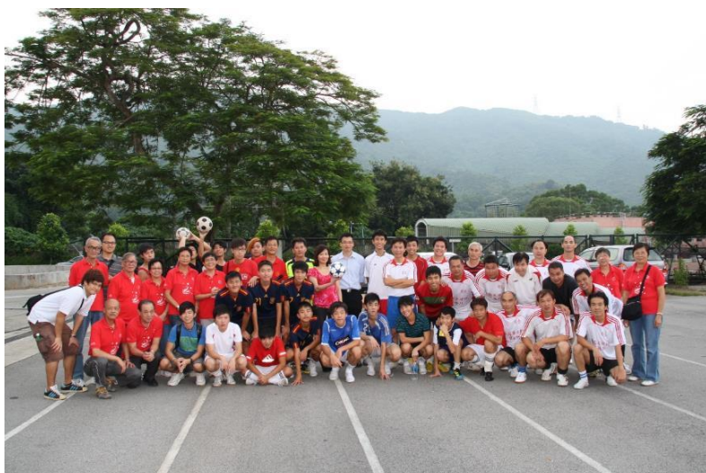
青少年與李村足球隊於友誼賽前合照。