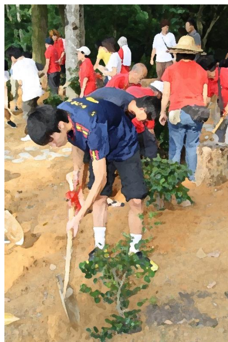
青少年與長者義工一同參與植樹義務工作。