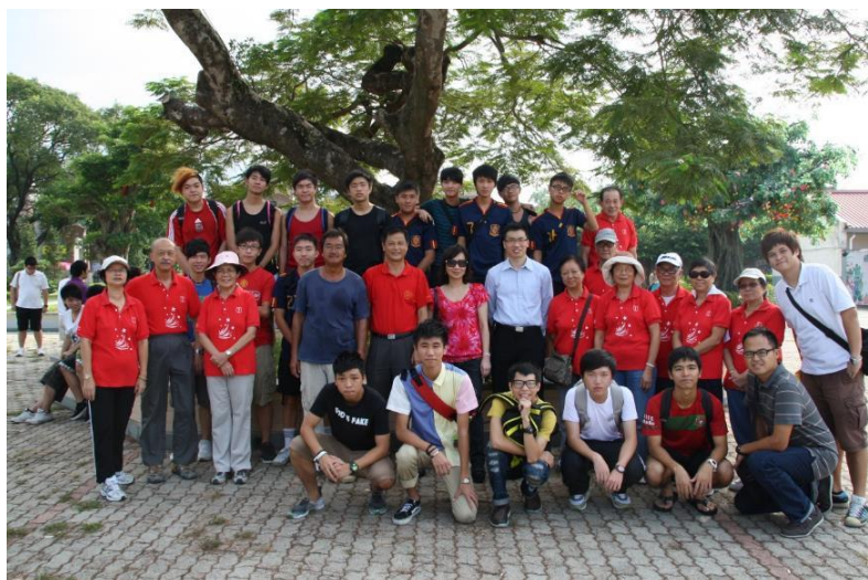
青少年與長者義工及嘉賓合照。