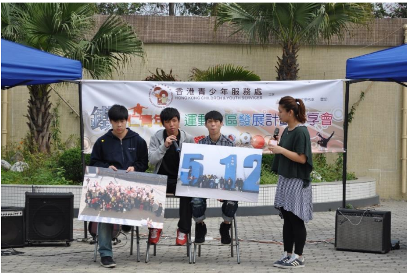
青少年分享四川義務工作的經驗。