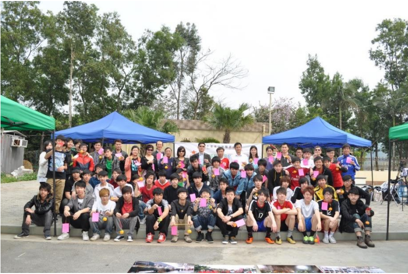
參與計劃的青少年與各嘉賓合照。