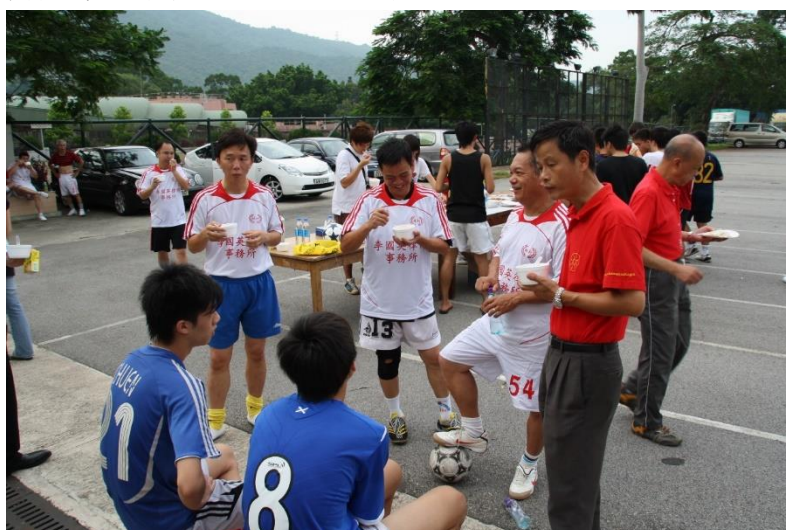
友誼賽後，各隊員互相認識。