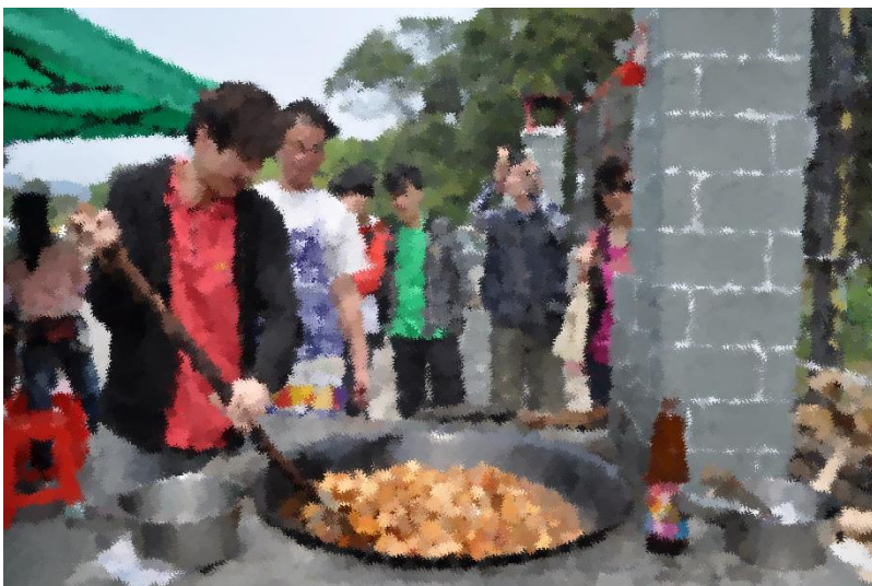
青少年學習製作傳統食物，認識大埔文化。