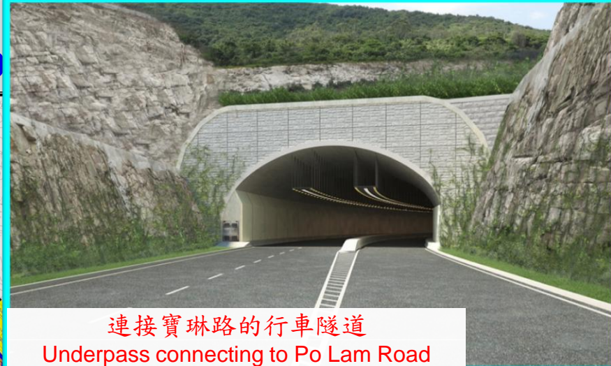
連接寶琳路的行車隧道 Underpass connecting to Po Lam Road

道路、供水、排水、排污和 環境美化工程 Road works, water supply, drainage, sewerage & landscaping works