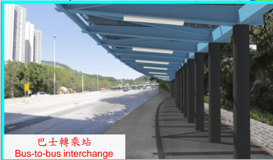
巴士轉乘站 Bus-to-bus interchange

地盤平整及相關土力工程 Site formation and associated geotechnical works