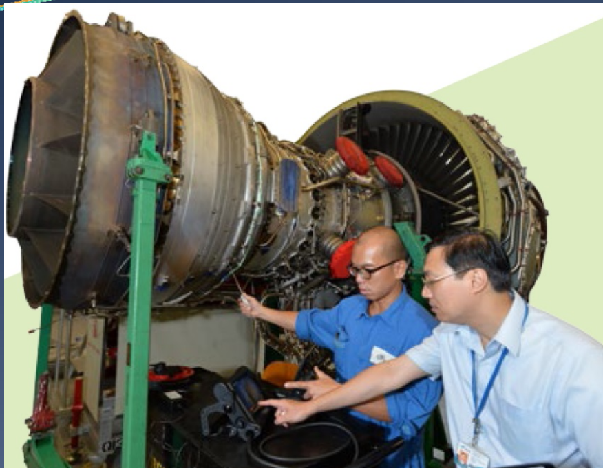
適航事務組人員到飛機部件維修機構進行產品審查