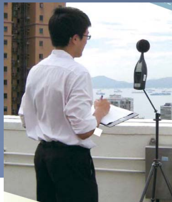
收集飛機噪音數據