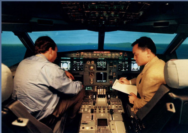
審查用作培訓的飛行模擬器