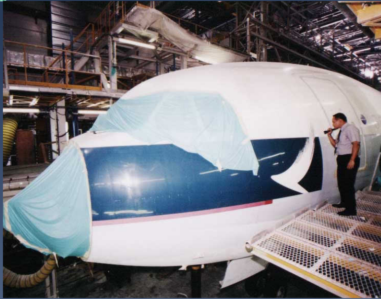
適航主任執行職務