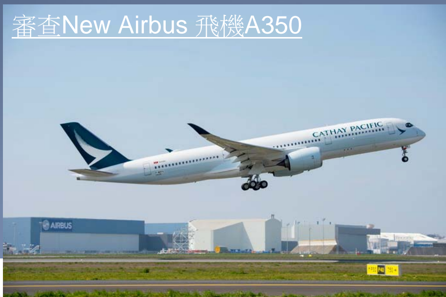
審查New Airbus 飛機A350