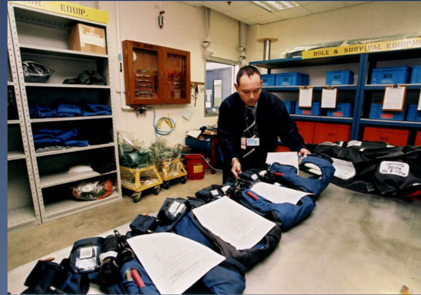
檢查航機上的救生設備