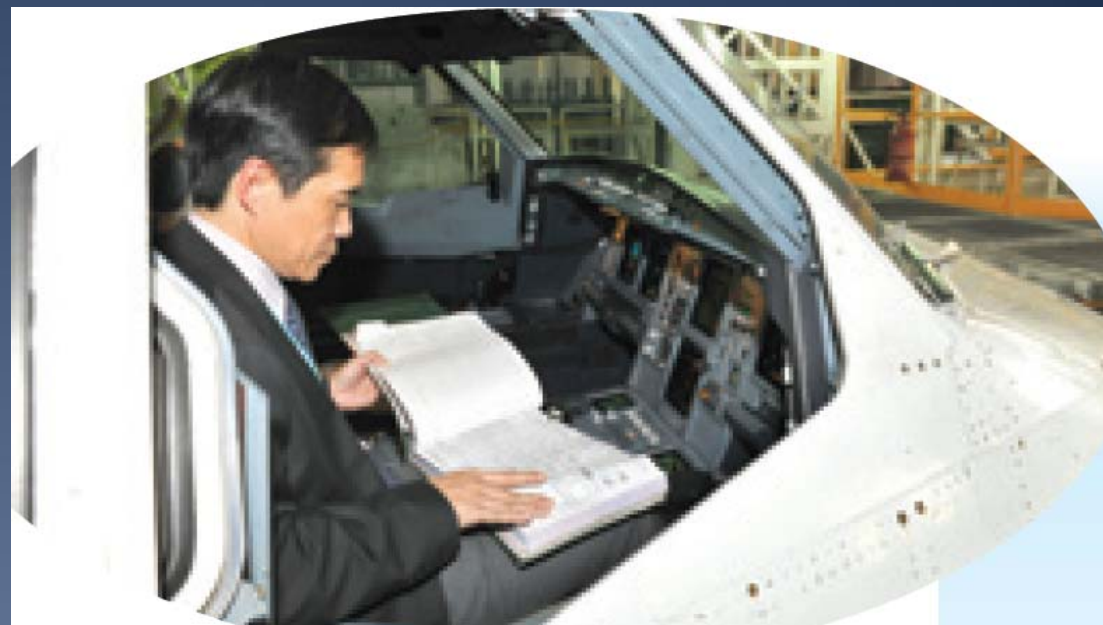
適航主任查閱飛機的維修記錄