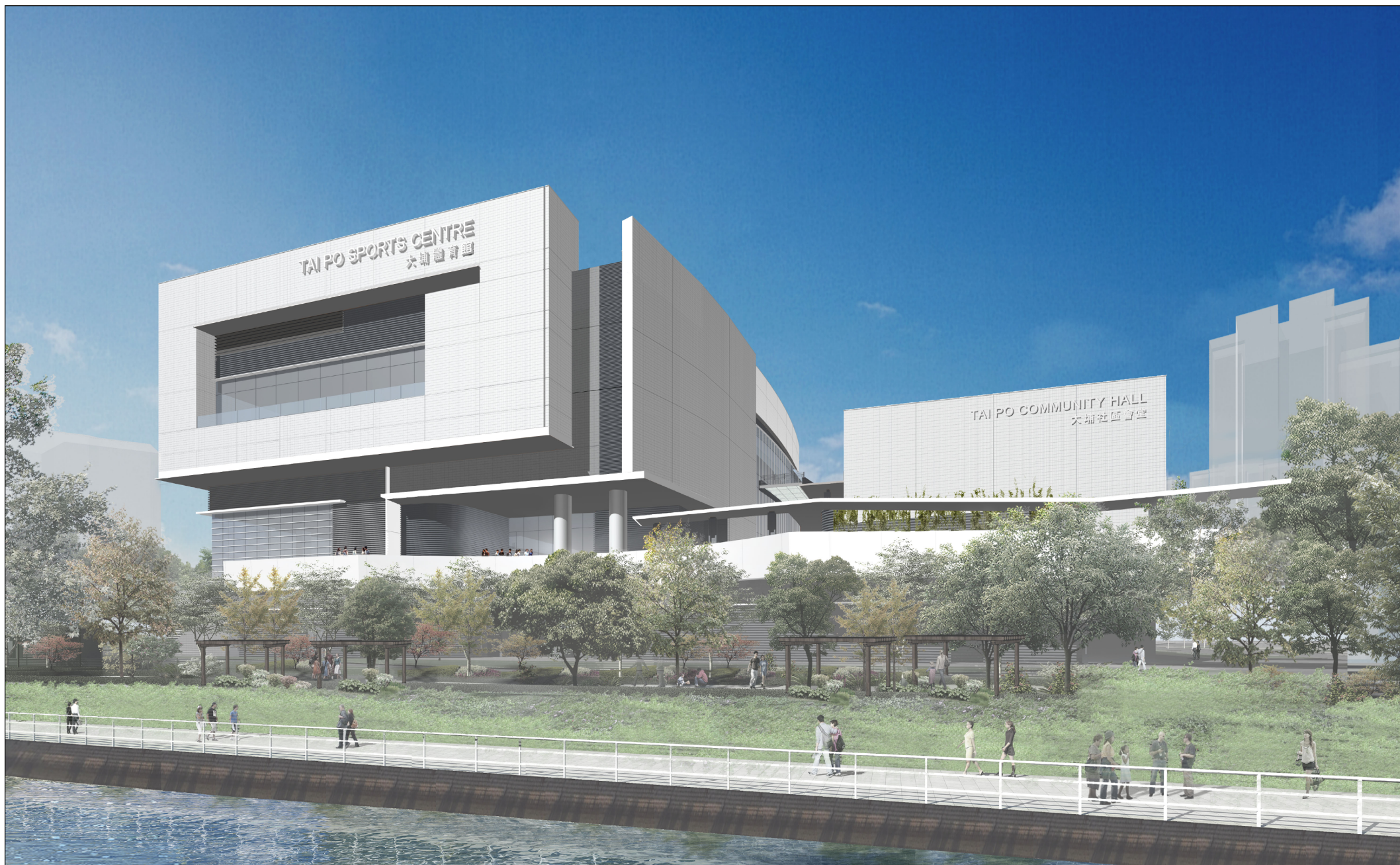
從北面望向大樓的構思透視圖 PERSPECTIVE VIEW FROM NORTHERN DIRECTION (ARTIST'S IMPRESSION)

57RG 大埔第1區體育館、社區會堂及足球場 SPORTS CENTRE, COMMUNITY HALL AND FOOTBALL PITCHES IN AREA 1, TAI PO