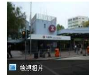
港鐵九龍塘站有乘客疑擅闖路軌

港鐵九龍塘站早上近九時半，發現一名男乘客懷疑擅闖路軌，職員其後將他帶回月台的安全位置，列車服務一度輕微受阻。