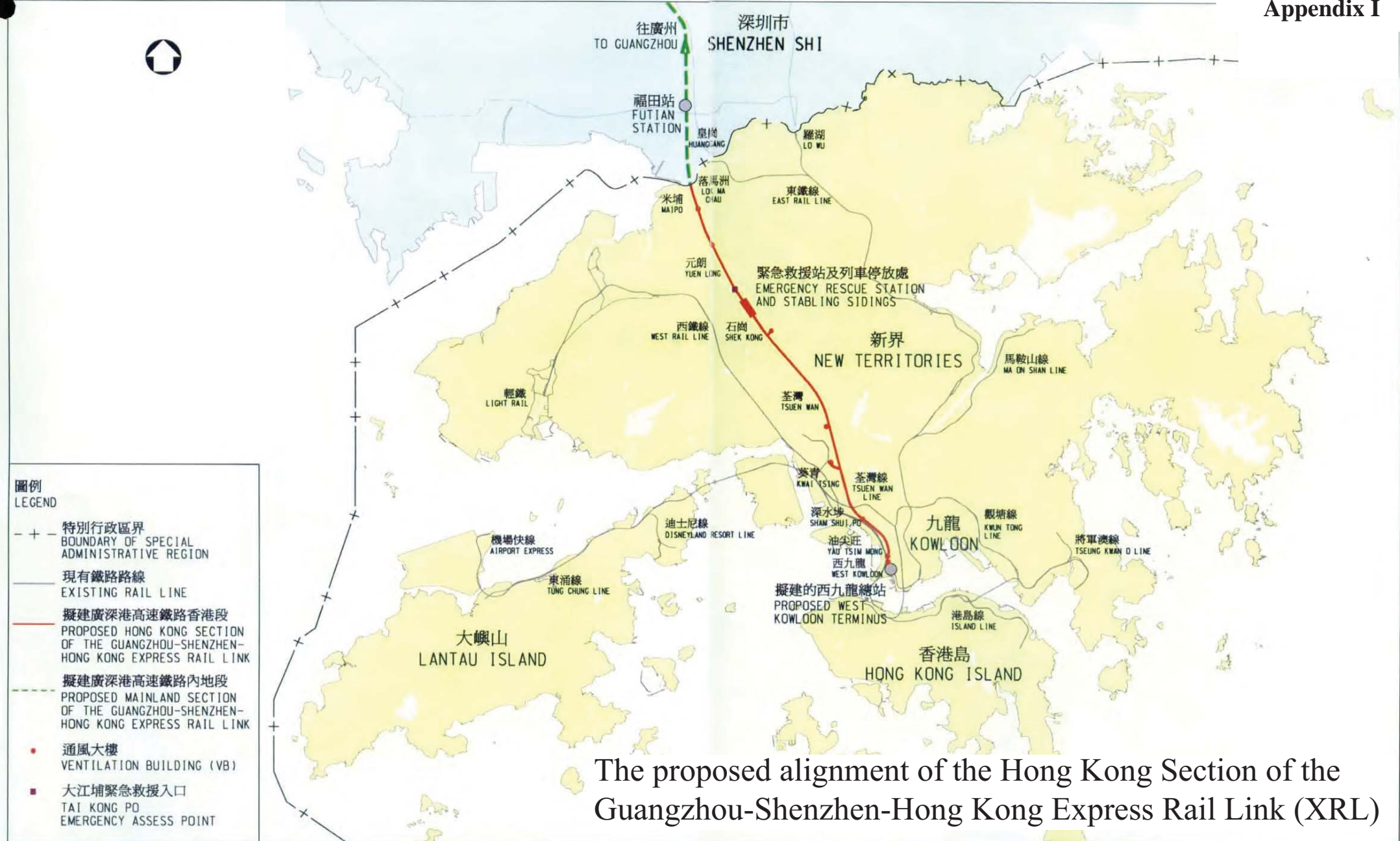
The proposed alignment of the Hong Kong Section of the Guangzhou-Shenzhen-Hong Kong Express Rail Link (XRL)