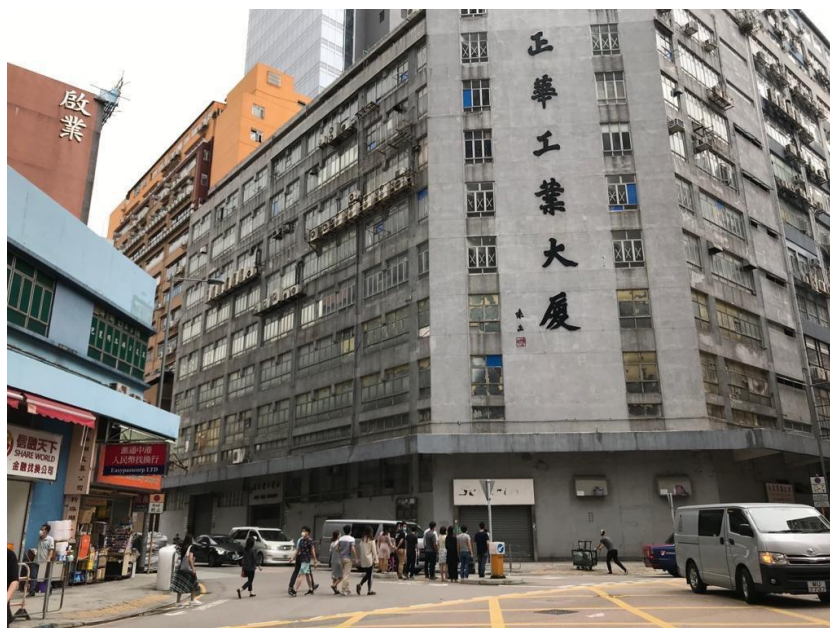
附圖二 ( 攝於平日周三下午五時・大有街 ):