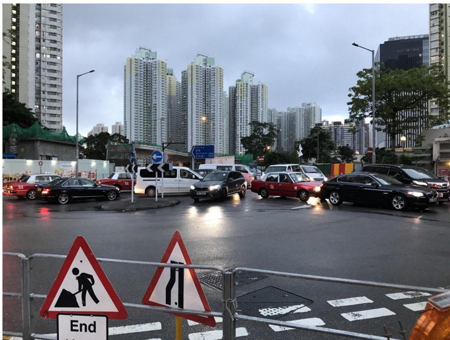
附圖四 ( 攝於平日周五上午十時 · 四美街 ):