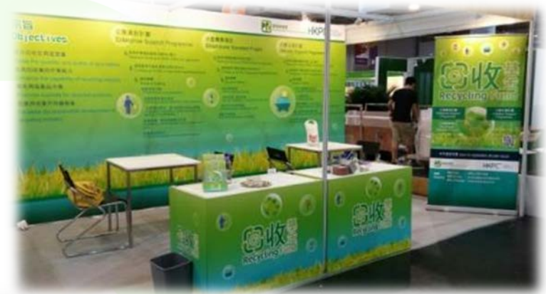
國際環保博覽展位