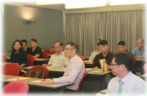
獲資助機構舉辦回收業研討會