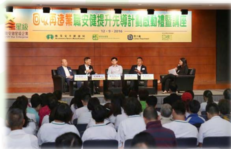
獲資助機構舉辦職安健計劃啟動禮暨講座