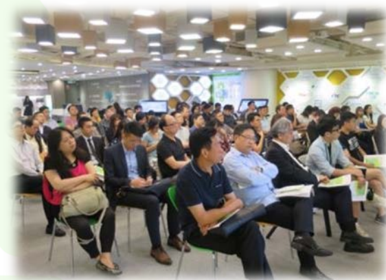
秘書處舉辦簡介會