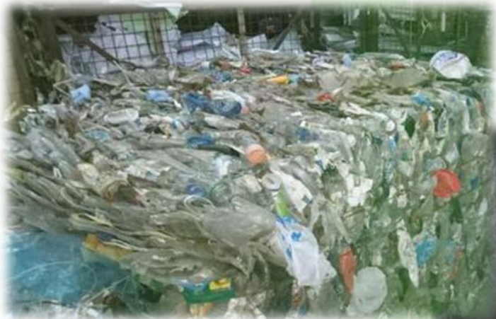
小型回收商收集廢塑膠樽