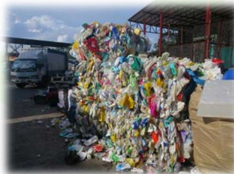
現場檢查項目實施場地