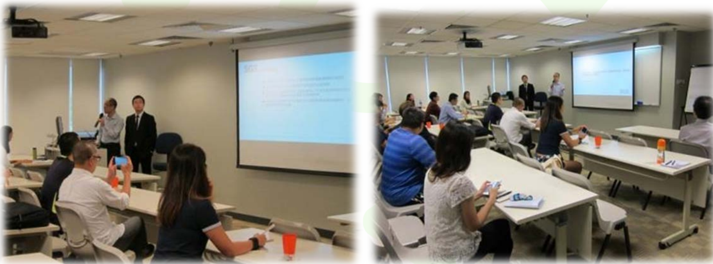
對回收商、獨立註冊認可會計師和認可的認證機構進行數量審計簡介