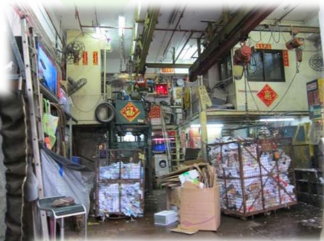
小型回收商運作情況