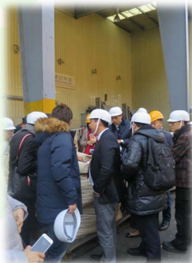
舉辦考察團以了解外地回收設施