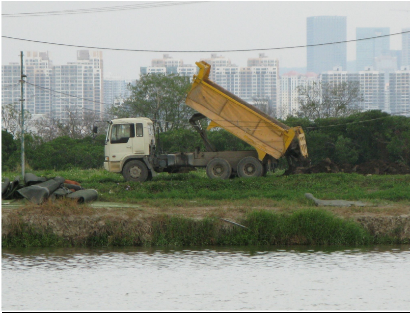
圖 9a 政府答覆連同漁護署就一個在魚塘傾倒建築和拆卸廢物（C&D 廢物）的投訴提出意見