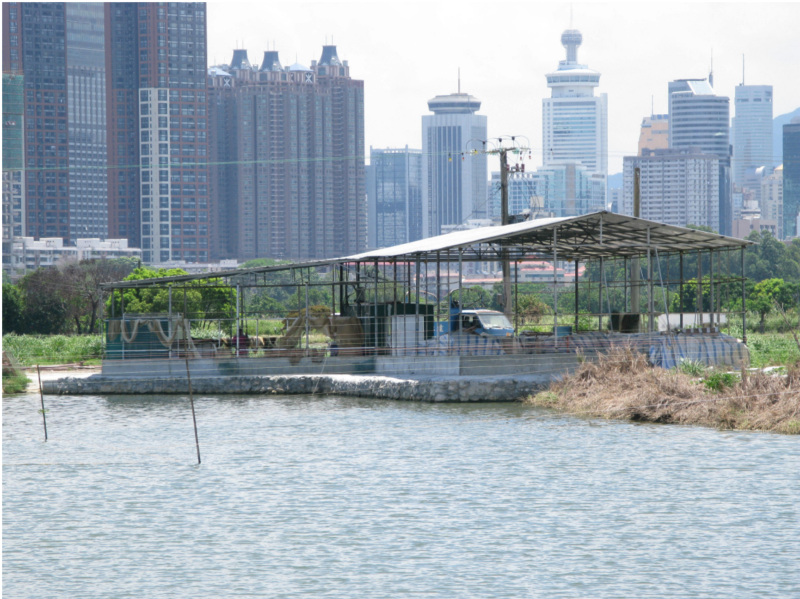
圖 5b 蠔殼圍 E / NE-MTL / 003 的執管資料