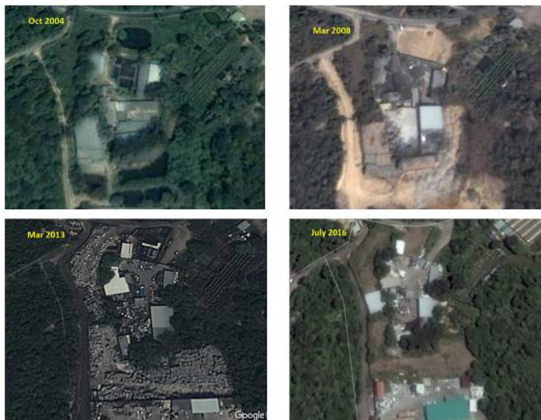
圖 4b E / YL-LFS / 187 案例的違規發展持續地域範圍和景觀變化