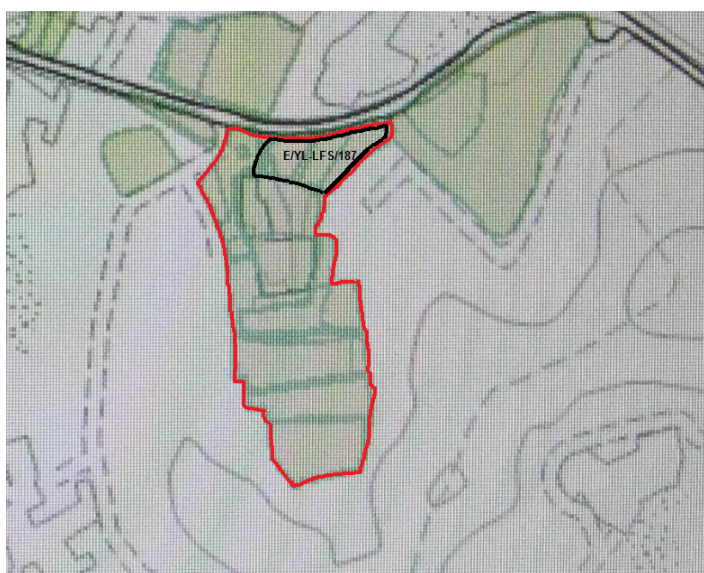
圖 4c 在 E / YL-LFS / 187 案件之後，在鄰近地區有超過 15 個違規發展受到執管（紅色框線內）