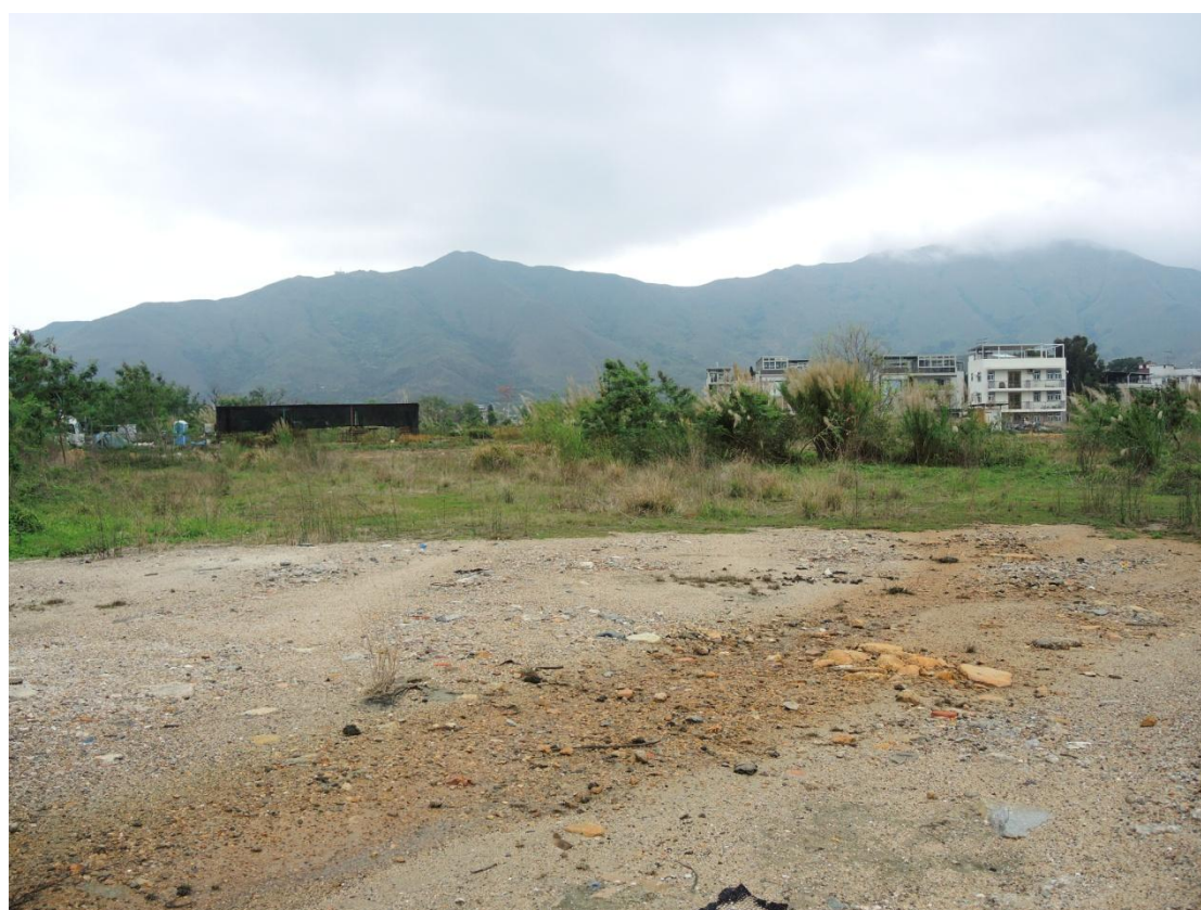
圖十二 現時該處濕地已不復見，荒草叢生，而草叢間仍能發現建築廢料