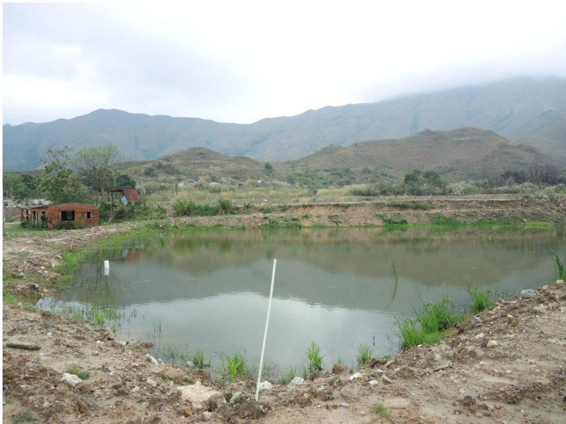
圖十 規劃署曾在錦田水牛田一帶進行多次執管行動，以個案 E/YL-KTN/254 為例，恢復原狀通知書上沒有標明移走多少泥頭