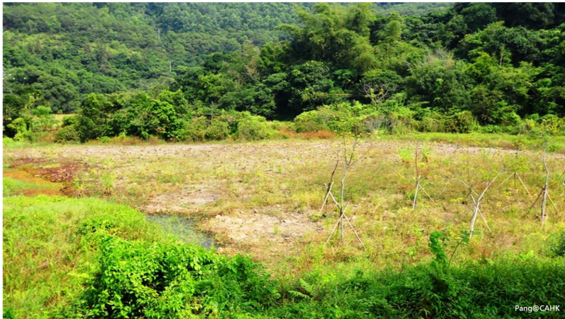
圖八 恢復原狀的地盤面積(紅圈示)，比起強制執行通知書(藍圈示)的地盤面積為細。該個案編號為 E/YL-KTN/334