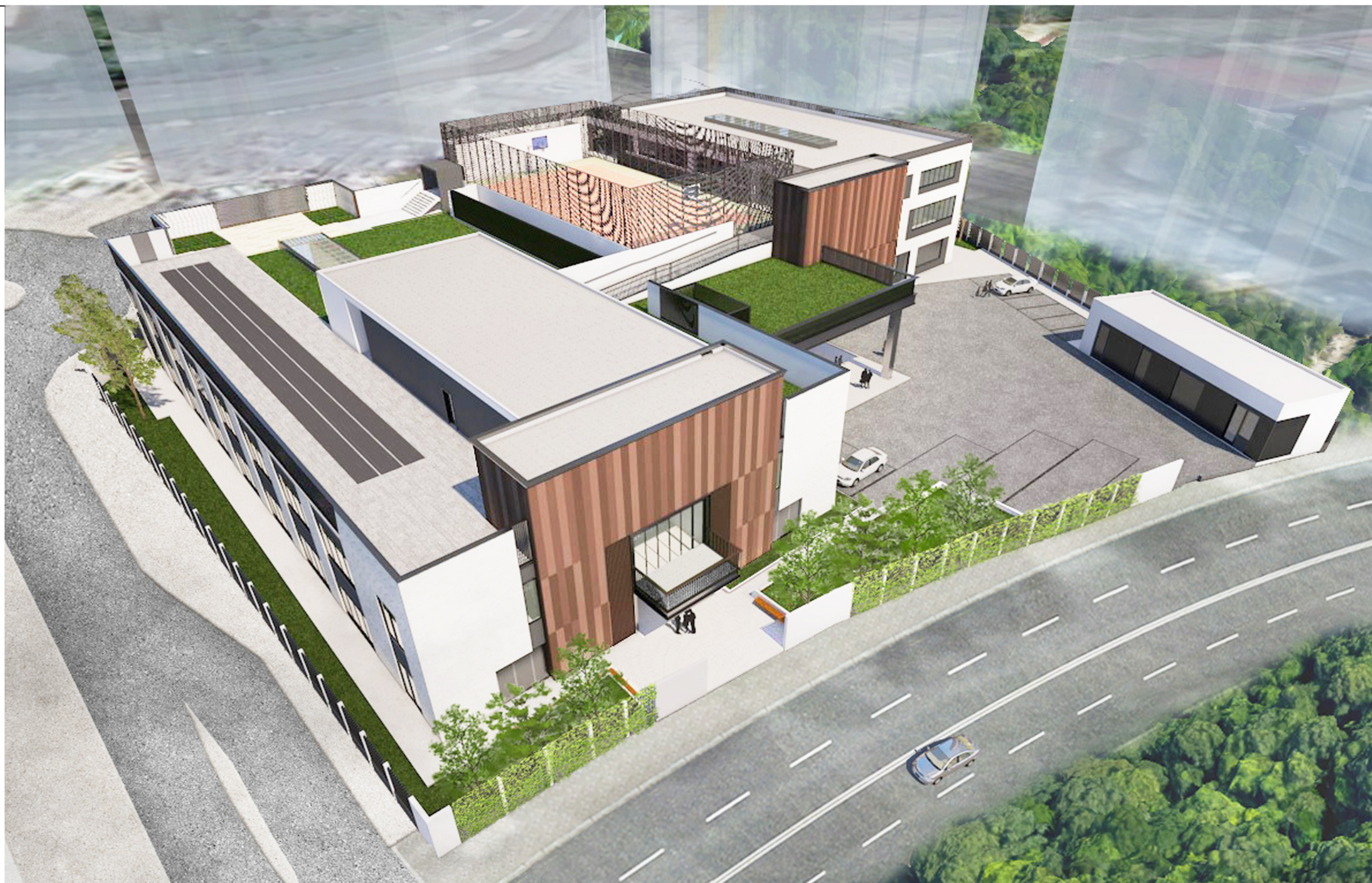
從西北面望向學校的構思鳥瞰圖 AERIAL VIEW FROM NORTH WESTERN DIRECTION (ARTIST'S IMPRESSION)